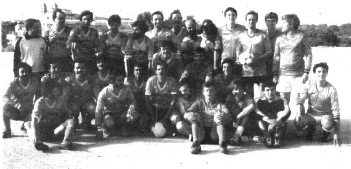
Foto dels dos equips que jugaren el partit inaugural. Al fons, el poble de Pina.