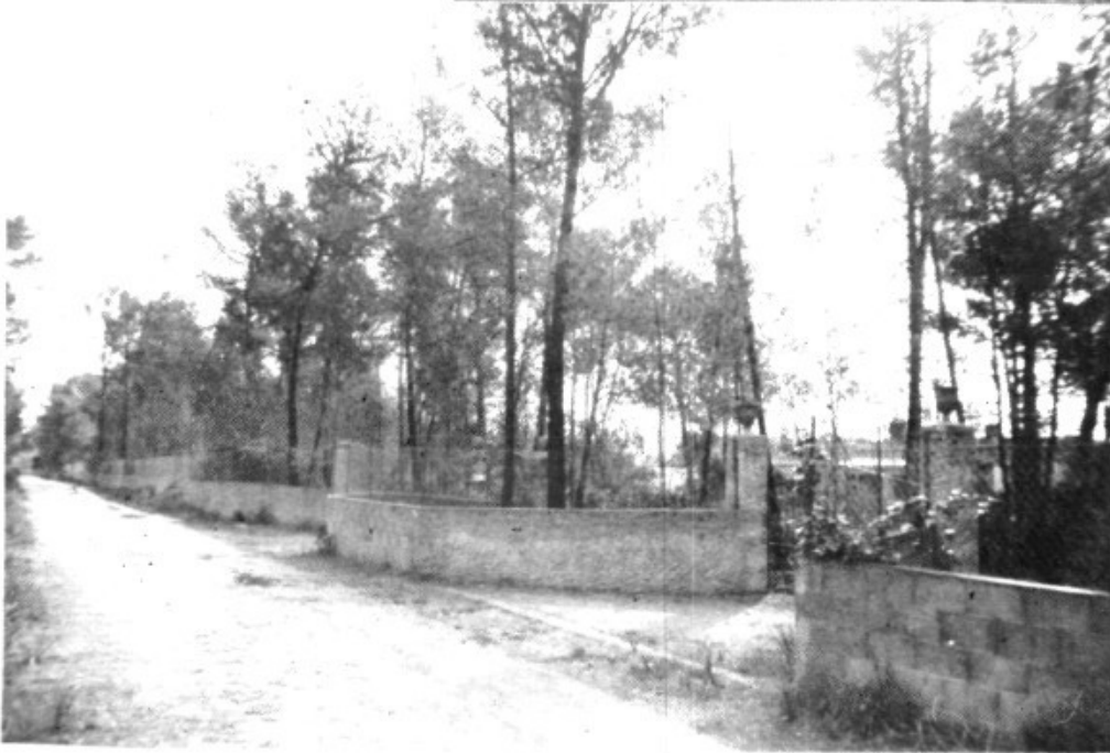
"Carrer" a Na Graciana