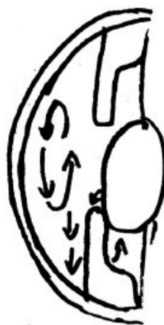
Fig. N° 2.

-Per regla general, els símptomes més freqüents solen ésser: