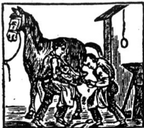
El ferrador, segons una suca vuit-centista.