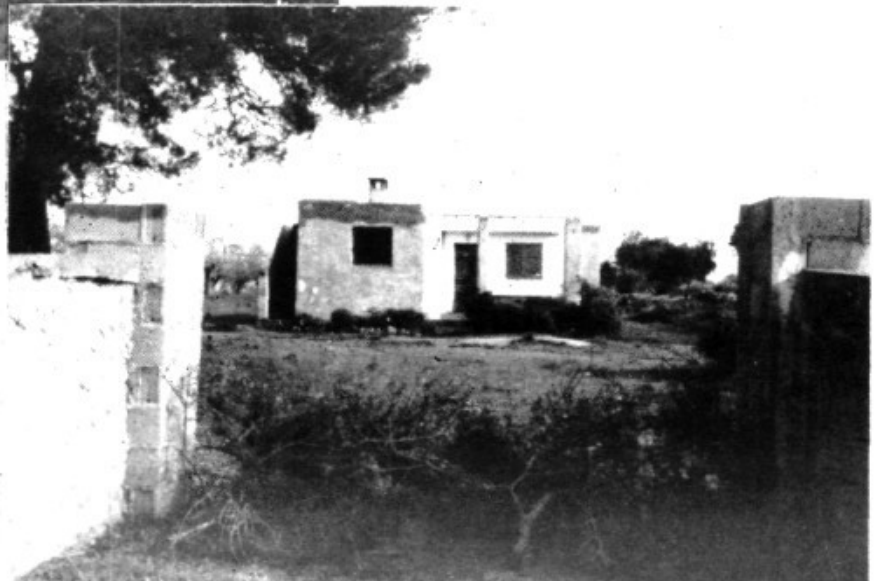
Xalet a Es Tancat Prim