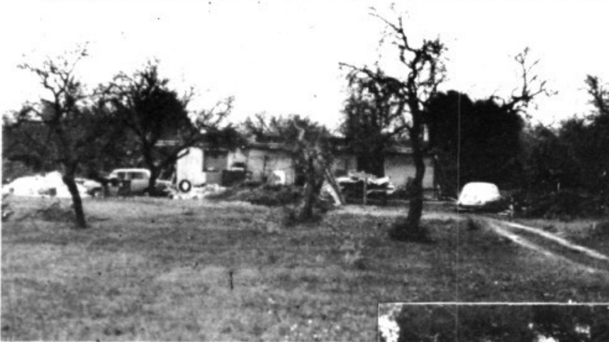
Xalet a Es Rafalet