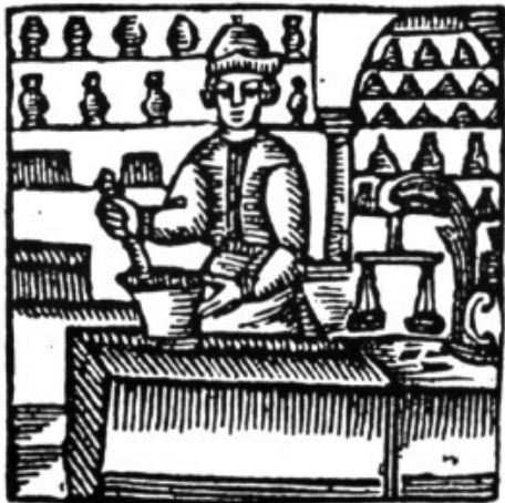
L'apotecari, segons una auca vuit-centista.

Cap al 1.738 hi tornava haver epidèmia i es contracta un metge per mesos: "Més 10 lliures pagades al Dr. en Medicina Joan Company i són pel treball d'assistir a los malalts en l'epidèmia qui estava molestant dita vila dit any"; aquestes 10 lliures són per la feina d'un mes. També es pagaven visites concretes a un malalt determinat: al mateix Company se li paguen "8 sous i són per ser anat d'orde de dits Regidors a Son Garbí per una dona de la vila d'Alaró que li prengué malaltia de la qual morí".