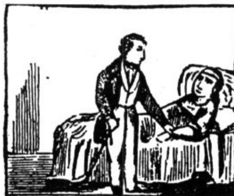
El metge, segons una auca vuit-centista.

La Universitat (nom que es donava a l'Ajuntament) era l'encarregada de contractar aquest servei; i pels documents queda clar que al poble moltes vegades no hi havia ni metge ni cirurgià. A part que escassejassin i fossin mals de trobar, sortien molt cars i les possibilitats pressupostàries del nostre Ajuntament eren molt limitades.