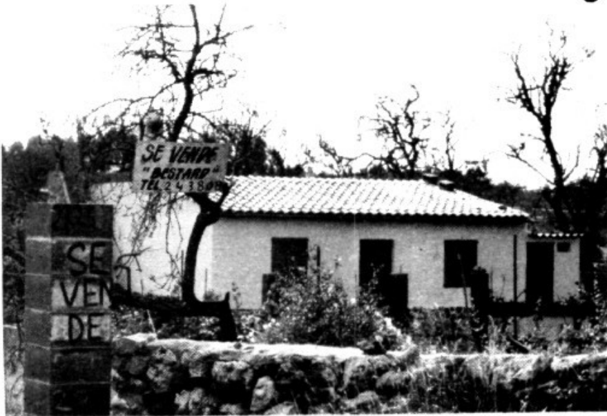
Camí de Ses Maioles (Tancat des Mort)