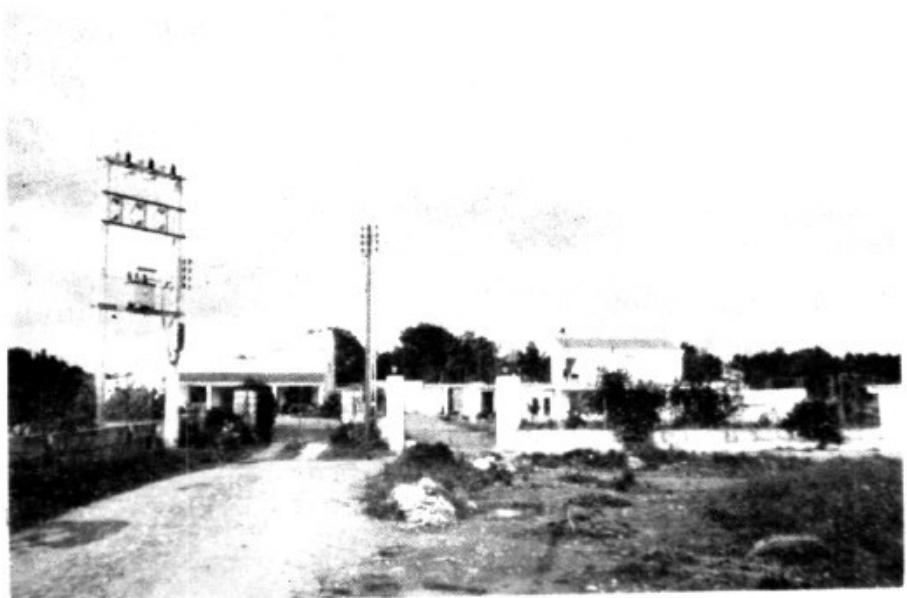
Grup de xalets a Ses Maioles