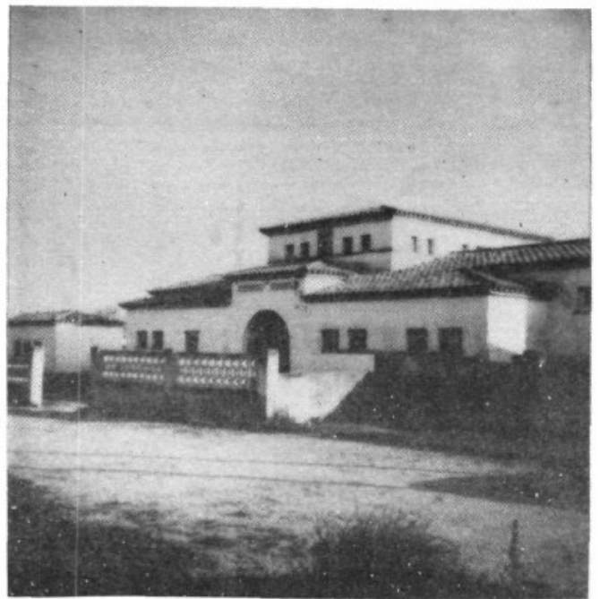
Una vista de l'escorxador que aviat deixarà d'esser el magatzem de la Cooperativa.

un poble agrícola, que la majoria de gent viu de la pagesia i que, per tant, la funció de l'Ajuntament és la d'afavorir el sosteniment de la base econòmica principal del poble.