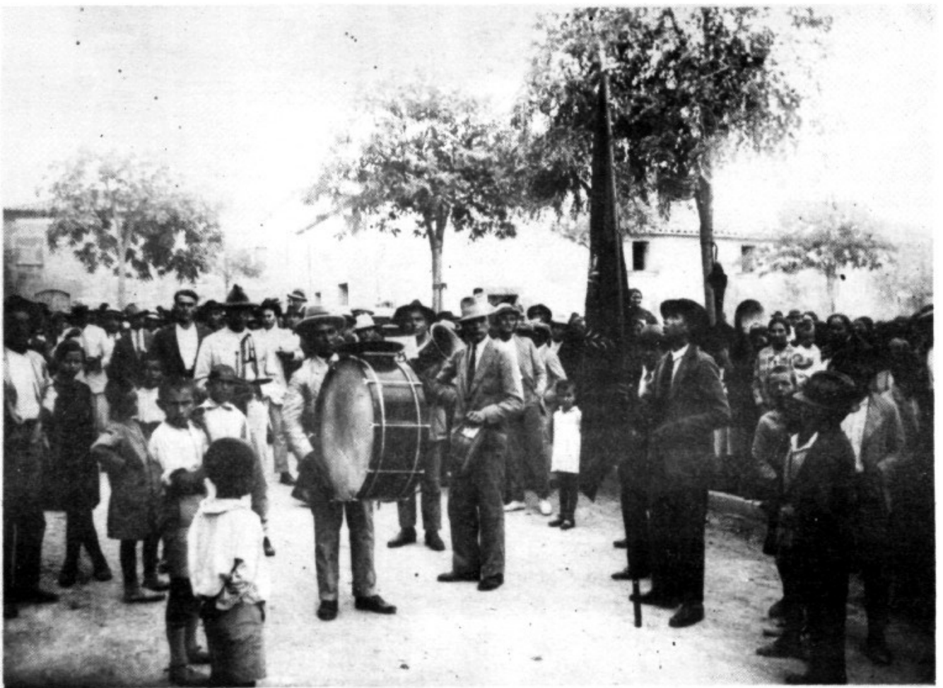
La Banda l'any 1930.