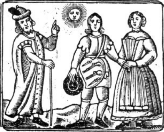
EL LLADRE I EL SOL

Hi havia una vegada un lladre de camins, un bandit crudel i sanguinari, i els seus amics li cercaven dona perquè es casàs; però un savi els va desenganyar amb aquest exemple: En certa ocasió el Sol es volia casar i totes les nacions acudiren a Júpiter a fi que ho impedís. Júpiter, tot extranyat, va demanar-los el motiu de la seva oposició a aquestes noces i li contestaren: "Perquè si ara que només tenim un Sol ja ens crema i és mal d'aguantar, què passaria si tengués fills?"