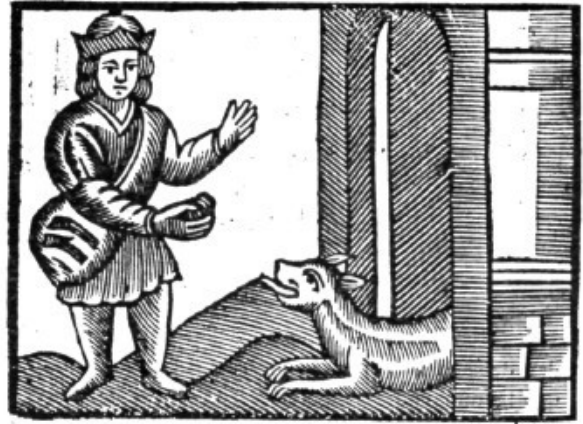
EL LLADRE I EL CA

No hem de fer el joc als dolents i malvats: hem de procurar disminuir el mal, no augmentar-lo.