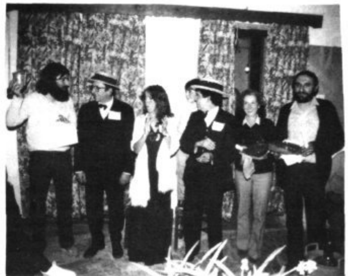
El jurat i els guanyadors del concurs

Moltes coses vos podríem contar de la vetlada, però que va esser del gust de tothom ho demostra la decisió unànime de repetir-la aviat.