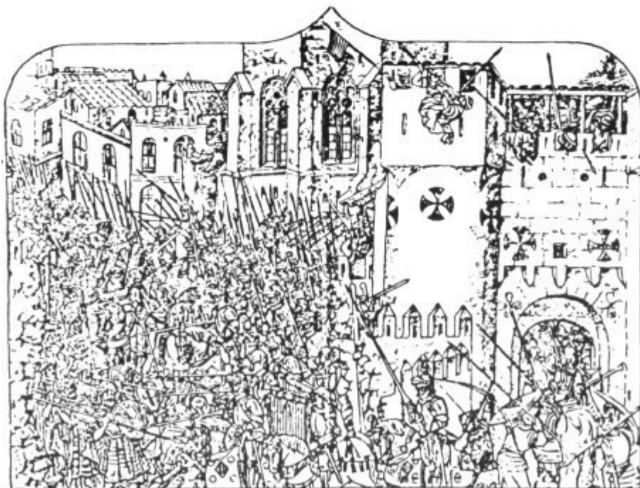
Dibuix d'un retaule del segle xv, representant l'entrada de Jaume I a la ciutat de Mallorca

La Procuració Reial, l'any 1420, donà llicència a Francesc Messeguer de Castellitx "que en la plaça de la pobla de Algayda de la dita parròquia, en lo loch acostumat star taules de carniceria, puxa fer e construhir una taula de carniceria ab son piló per tallar carns acostumades a tallar", però havia de pagar al rei un cens anual de 8 sous. (ARM RP 3.831 f.58).