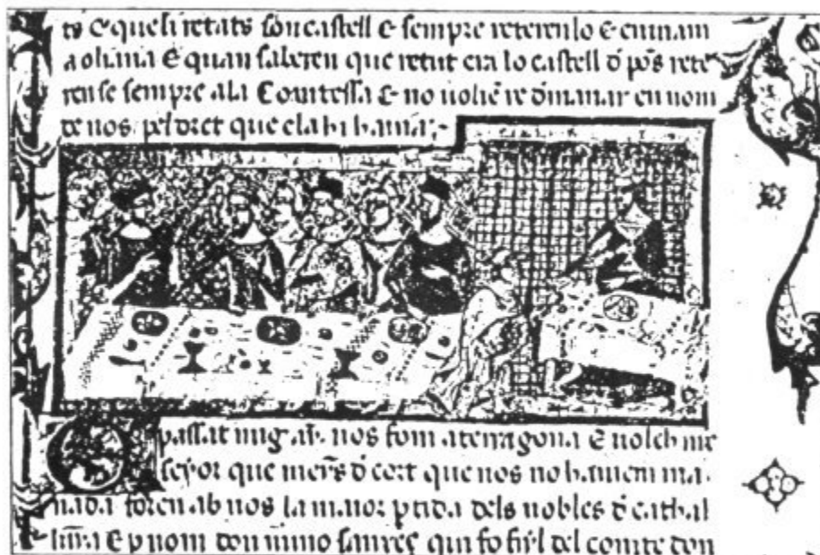
Miniatura de la Crònica de Jaume I (còdex de Poblet) que representa Jaume I dinant amb els nobles en el convit de Pere Martell a Tarragona

Els qui, però, realment intervenien i administraven l'economia local eren els jurats, en nombre de quatre, i els consellers que els assessoraven. El 1444 els jurats de Castellitx obtingueren llicència per manllevar 50 lliures i convertir-les en compra de blat per assistir les necessitats. (ARM Guiatges 8 f. 161).