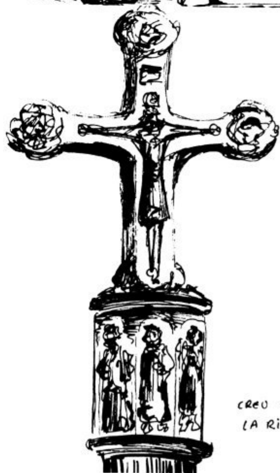
CREU DE LA RIBERA