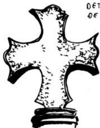
DETALL CREU DE LA GARRIGA