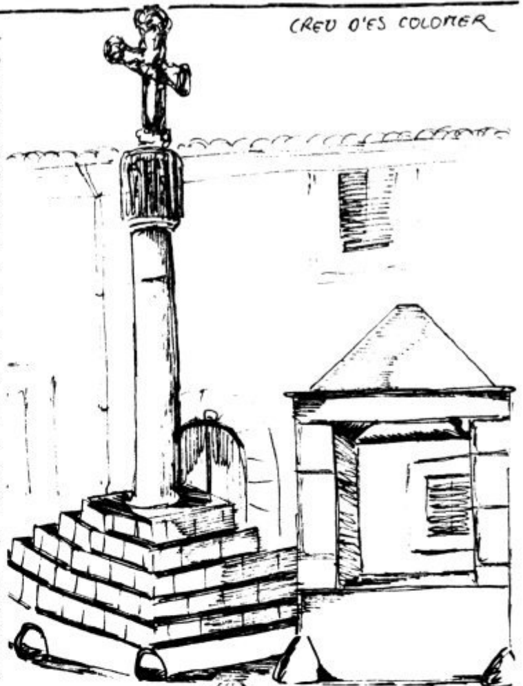
CREU D'ES COLOMER

(Amb petits retocs, aquest és el suplement nº 1 que es va repartir entre els socis d'Obra Cultural d'Algaida pel novembre de 1976.