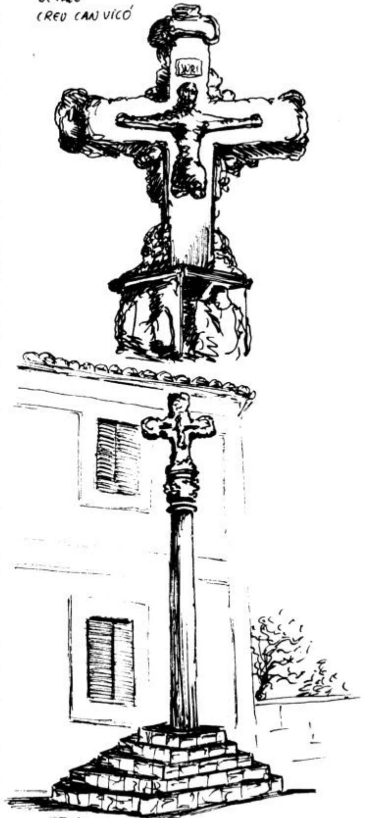
(CREU DE CAN VICÓ)