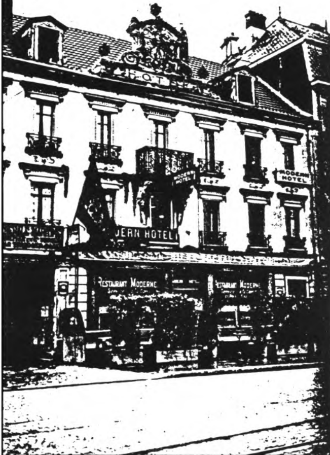
BELFORT. - En face la Gare, Modern Hôtel, Avenue Wilson