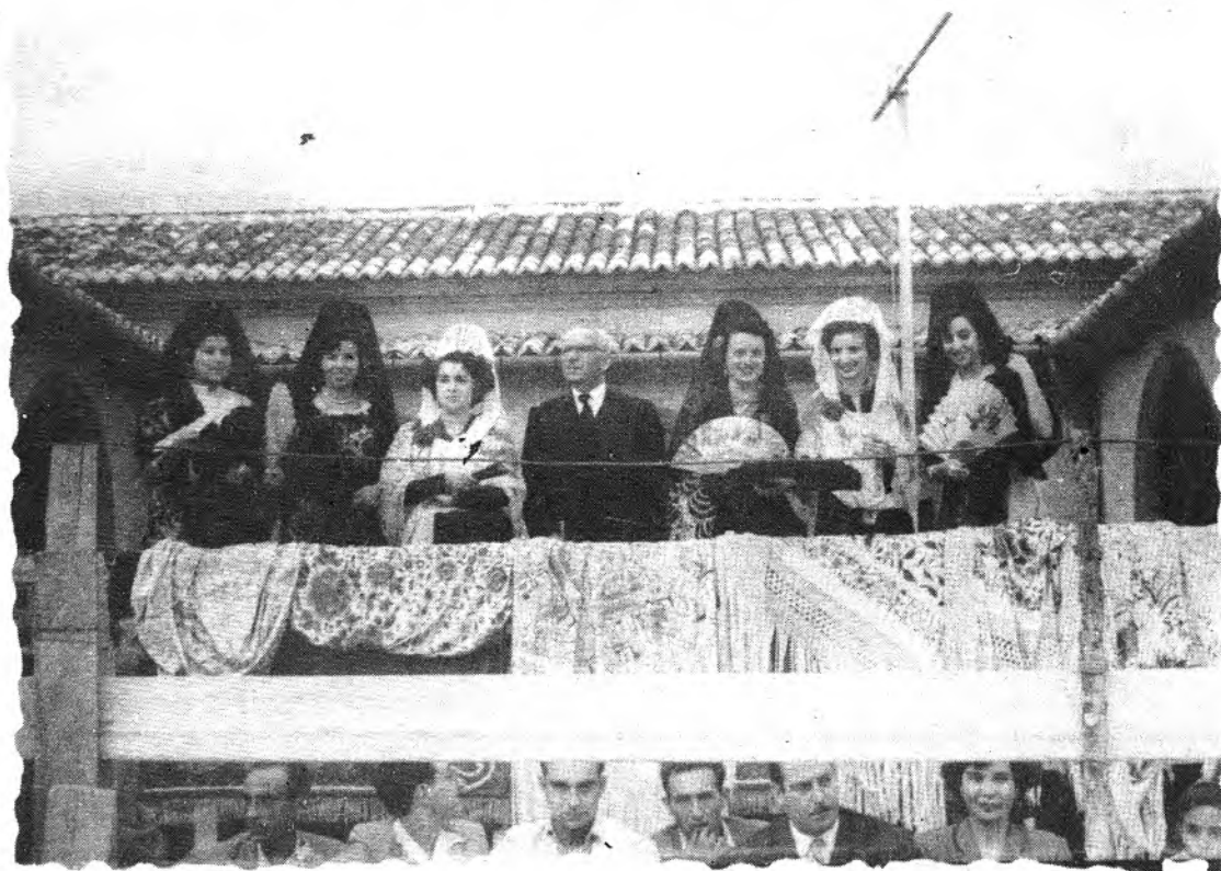
No vos equivoqueu: no són amigues de "La Collares" ni de la "Lola de España"; són un ramell bunyolíssim, això sí, vestit amb "mantilles" i "peinetas". ¿Per què no van vestides de pageses?.