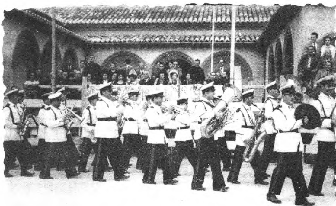
Banda de música a l'escola per Sant Mateu de l'any 1952. Ja per aquell temps animaven les nostres festes. Tota una tradició!!