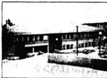
Escuela de Magalluf

Avenida S'Olivera: Acera sin asfaltar, mucho ruido, tráfico peligroso sin respeto a