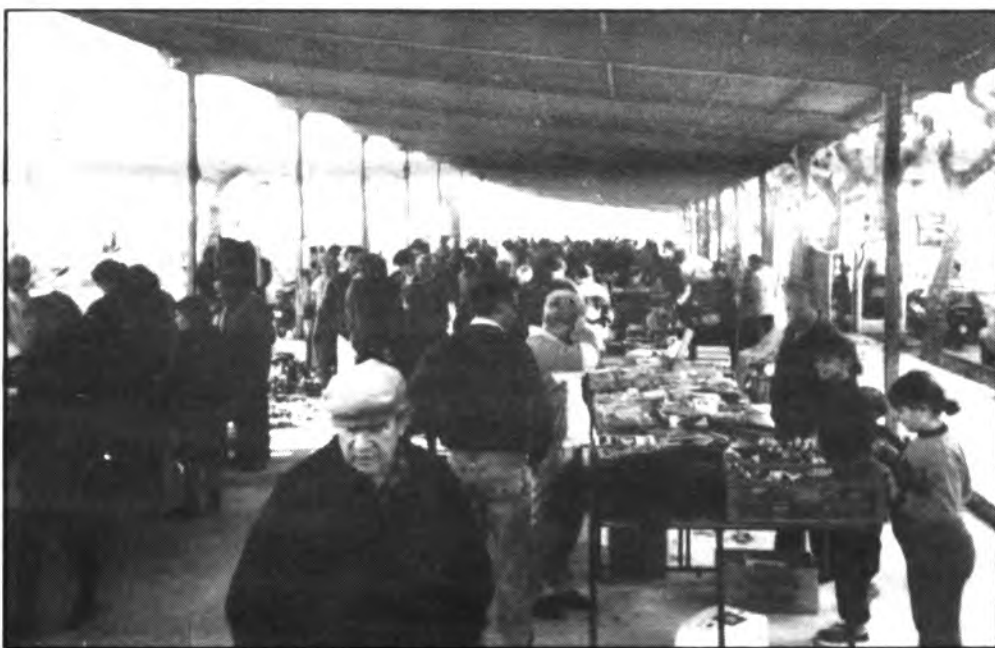
La Plaza des Bestiar fue una fiesta.