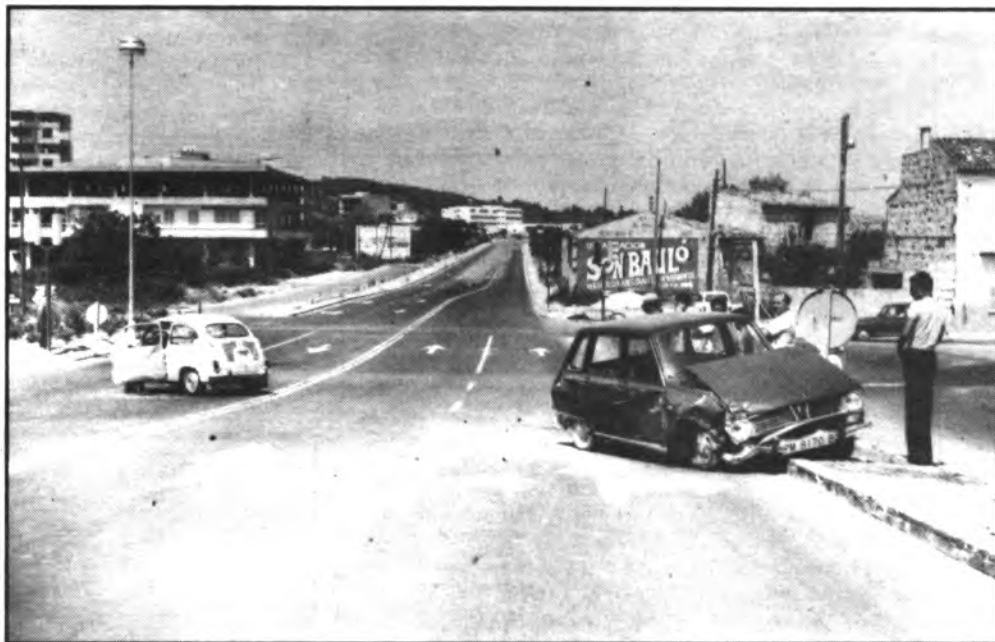
¿Cuándo se iniciarán los trabajos de la rotonda del cruce de la muerte?

Ahora, cuando iniciamos la recta final del mes, se comenta que las obras se iniciarán en el curso del próximo mes de Noviembre y que en consecuencia las movilizaciones de momento se encuentran en un compás de espera a fin de comprobar si