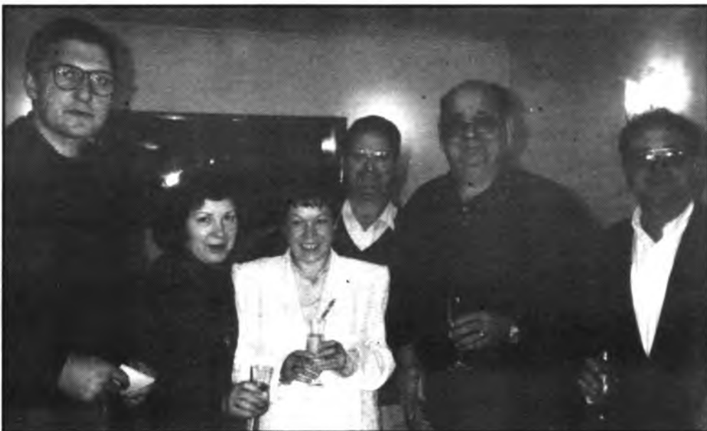
L'Associació de Comerciants, organiza un año más les Fires d'Inca.

efectivamente estos trabajos se inician o no.