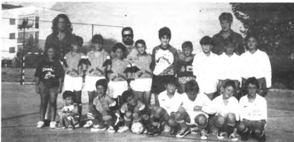
Equipo Alevín del Juventud Inca de futbito.

Primer partido del novel equipo del Juventud Inca, F.S. que sucumbió frente al equipo pamesano del Sant Antoni Abad por el rotundo resultado de cero a diez.