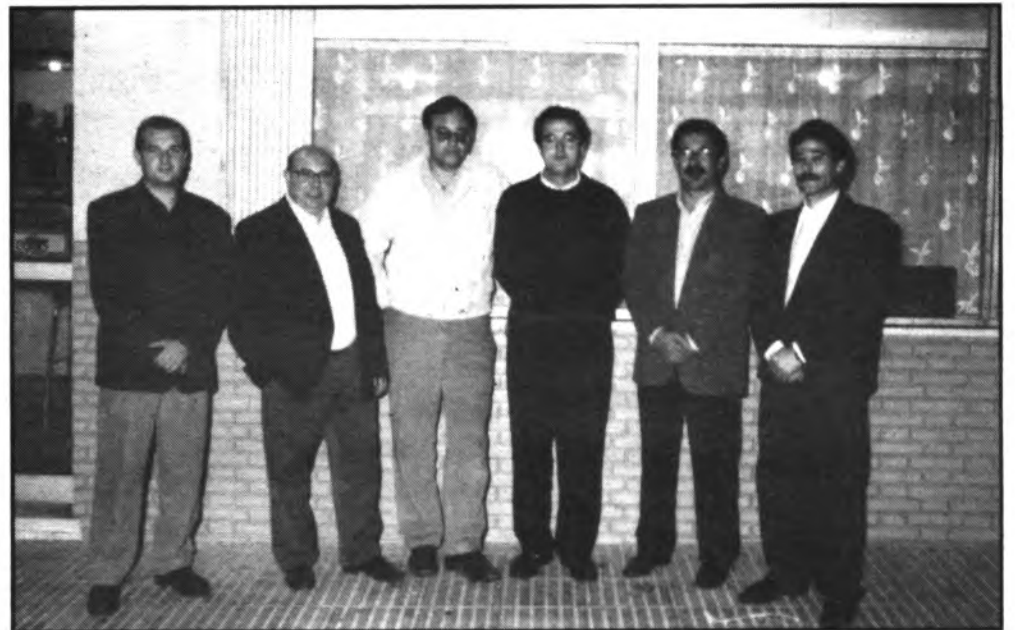
La nueva junta directiva.