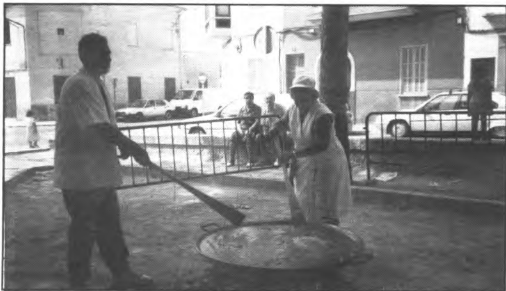
«Cinc Germans» preparó tres paellas para 350 personas.