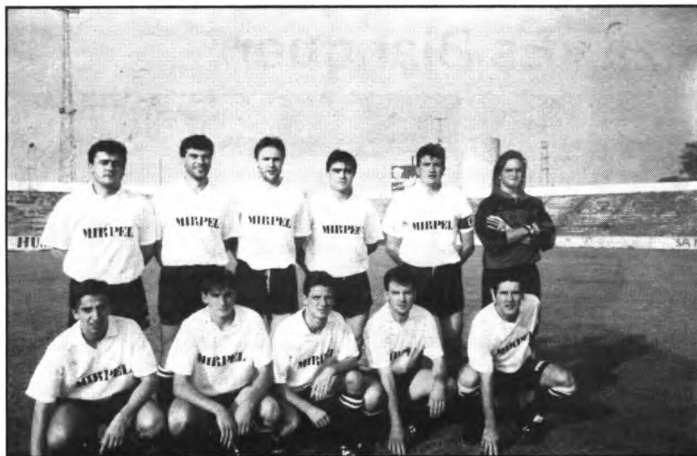
Equipo del C.D. Constancia.

Jugó el equipo local bien durante todo el encuentro, en especial, en el transcurso de la segunda mitad en que se impuso la clase de la línea medular muy bien secundada por el sistema defensivo y apoyada en la gran profundidad por la