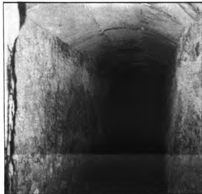
Una mina de la Canaleta.