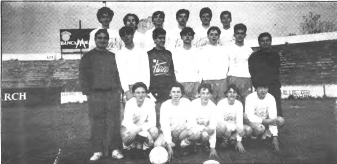
Equipo Juvenil Bto. Ramón Llull.

Victoria justa y merecida la cosechada por el equipo juvenil del Beato Ramón Llull en la jornada inaugural del campeonato de liga frente al equipo representativo de Alaró.