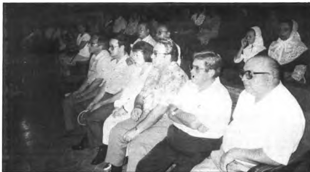
La imagen, fue captada el pasado domingo en el templo de Santo Domingo de Guzmán de Inca.

En verdad, resulta aleccionador el poder comprobar como los representantes de los partidos políticos que comportan el actual consistorio, saben cumplir con su cometido como representantes del pueblo y estar donde se debe estar.