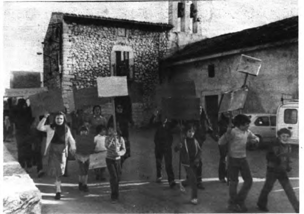
Plaça de Biniamar.