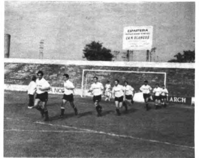
Los jugadores del Constanca saltaron al terreno de juego dispuestos a ganar.

Primer partido del Constanca en su feudo del Nou Camp y primera victoria frente al histórico Atl. Balears. Una victoria Justa y merecida, acompañada de buen fútbol y tres goles favorables al equipo de Inca.