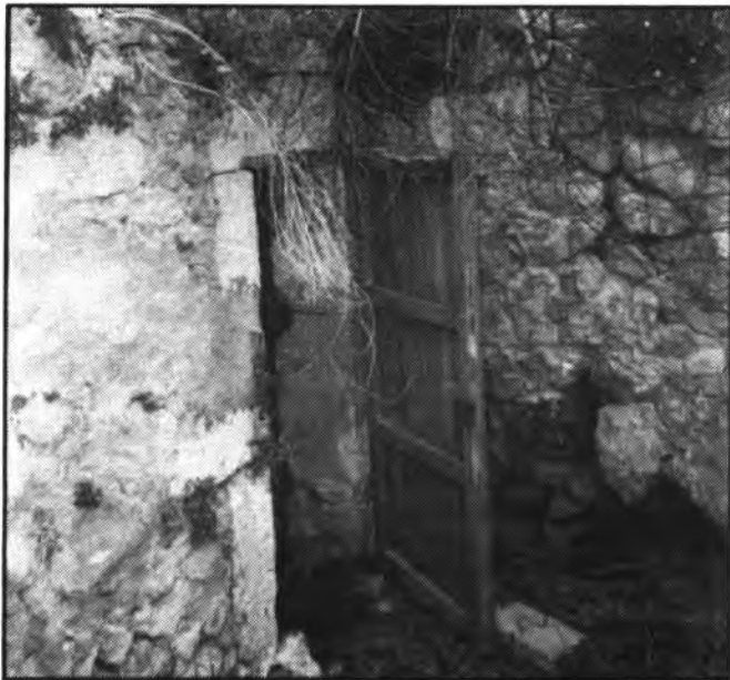
Entrada a les mines de la Font de la Canaleta (Font de Ses Roquetes i Font del Grifó).

No gaire lluny de la dita font hi ha la Font de la Canaleta, que te dues mines que condueixen a dos pous. La mina que va cap al Nord condueix a la Font de les Roquetes i la que va de cap a la Serra de Tramuntana, és diu la Font del Grifó. O sia que tota la zona de devora la plaça del Bestiar conforma un sistema hidrogràfic digne dels estudis i conservacions del Bestiar conforma un sistema hidrogràfic digne dels estudis i conservacions més bells i agra-