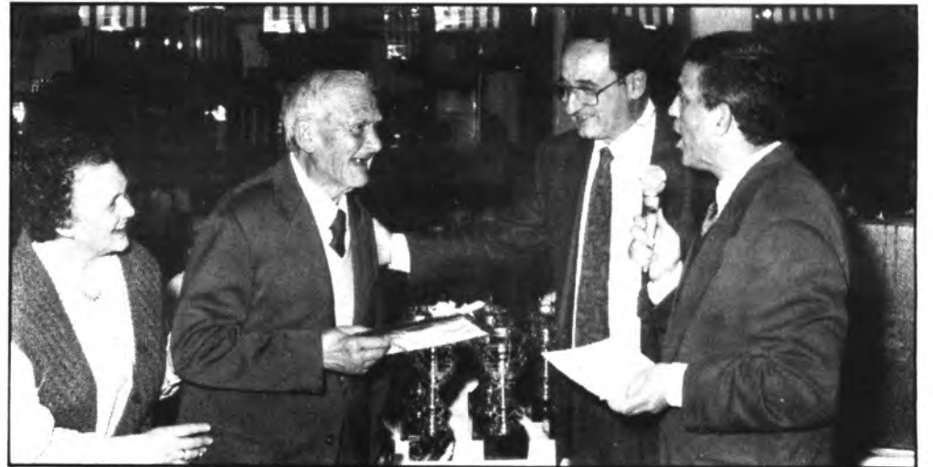
La Noche del Deporte, un nuevo éxito.

La Noche del Deporte, es de todos, principalmente de la familia deportista. Los deportistas con sus títulos pueden mejorarla y entre todos tenemos que conse-