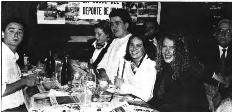
■ La juventud, estuvo presente en La Noche del Deporte.

Con la entrega de unos ramos de flores y un prolongado aplauso por parte de todos los asistentes, se dió por finalizada la fiesta. Una fiesta que tuvo una duración de cuatro horas.