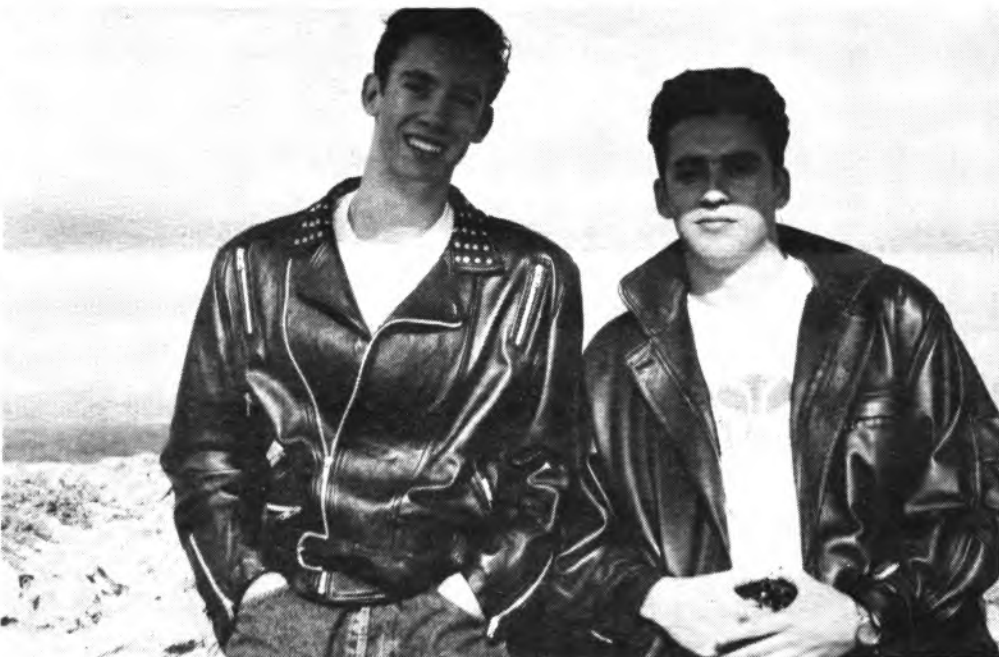
«Private Zone» un grupo de Inca, para una fiesta un tanto especial.

dad, especialmente el mundo juvenil local, toda vez que «PRIVATE ZONE» cuenta con una bien merecida popularidad dentro del mundo juvenil y del mundo de la música moderna.