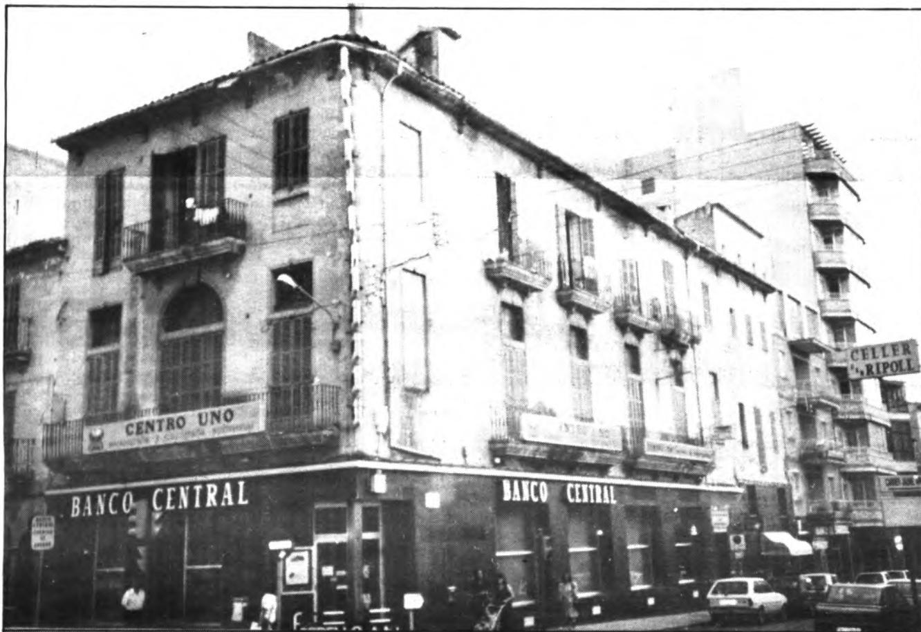
El cierre comercial, paralizó en el día de ayer la ciudad de Inca.

El cierre comercial, convocado por AFEDECO y PIMECO fue secundado por un elevado número de comercios