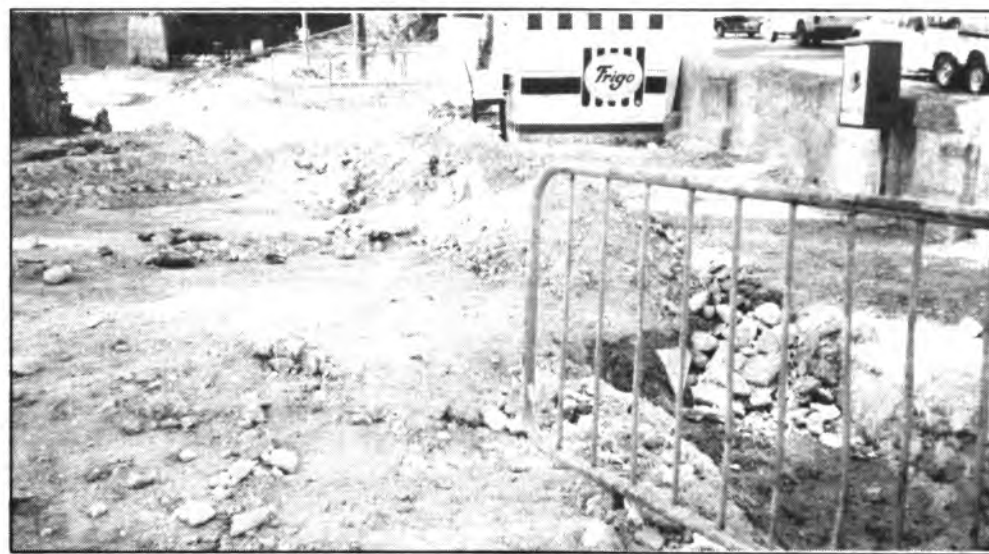
Acequia de la Plaza de Mallorca.

do actual que es como decir es el de siempre, las jardineras son un estorbo en la vía pública. No desempeñan su función por las cuales fueron colocadas y al mismo tiempo son foco de colillas y vertedero de latas y papeles.