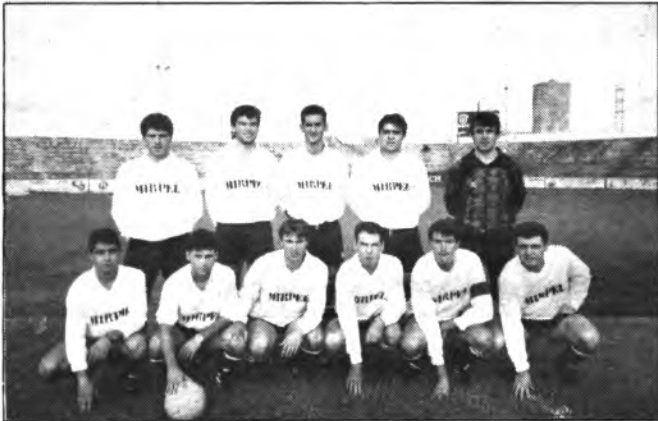
Equipo del Constanza.