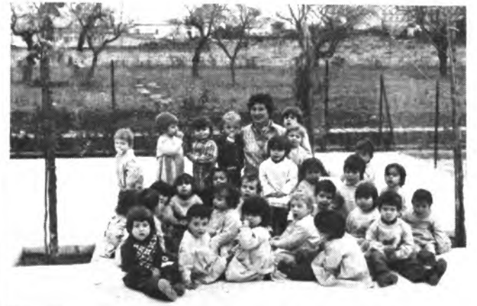
Interesante cursillo en Toninaina.