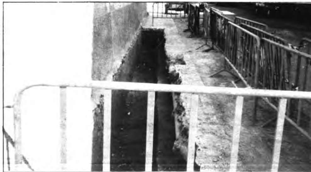
Acequia de la calle Juan de Herrera.