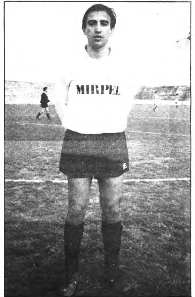
Quetglas, incisivo delantero del Constancia.