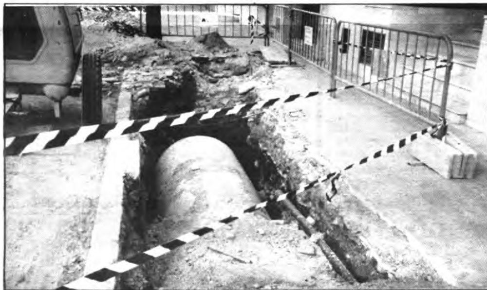
Acequia Avinguda d'Alcudia. (Foto: ANDRES QUETGLAS).