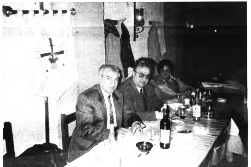
Agradable festa del Sindicat Obrer la Pau.

La festa acabà molt bé, amb alegria i ganes de continuar el treball començat l'any 1913. Des d'aquí volem especificar que dit Sindicat és avui una entitat cultural i no un Sindicat en el sentit lògic de la paraula.