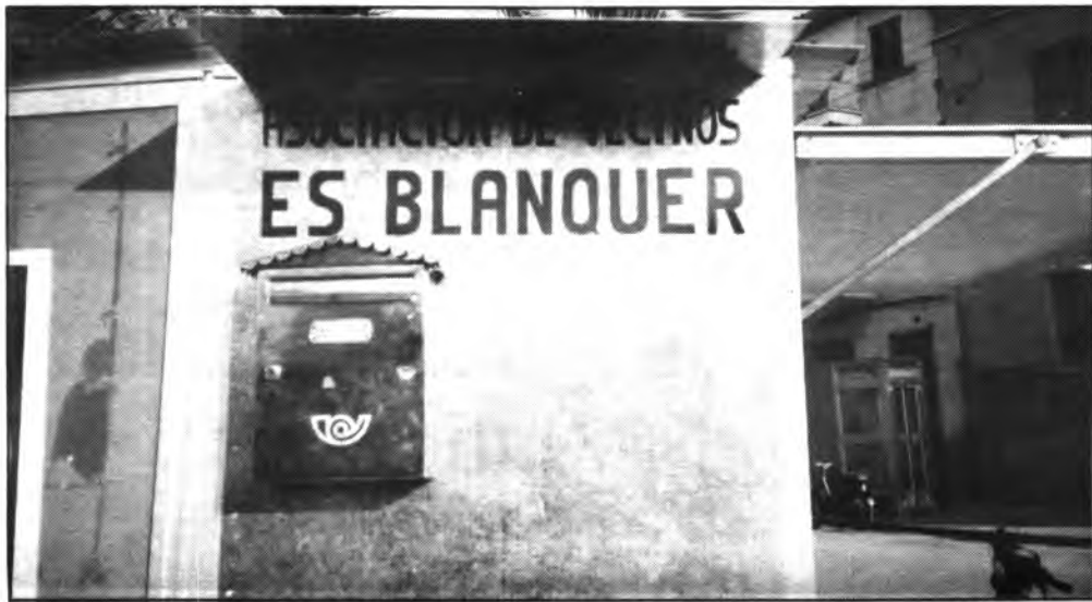
Buzón de sugerencias instalado en la Plaça Des Blanquer.