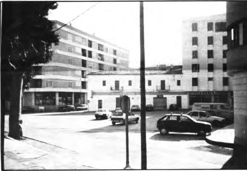
45 plazas de aparcamiento de zona azul, en la Plaça de Sa Font.