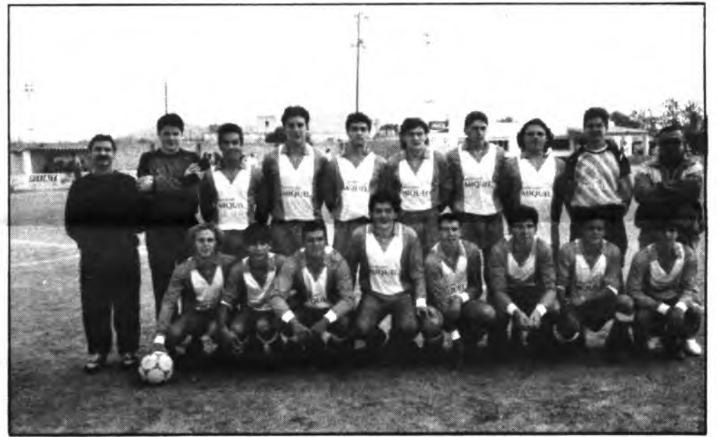
Sallista Juvenil A.

Con éste nuevo triunfo, siguen los benjamines del