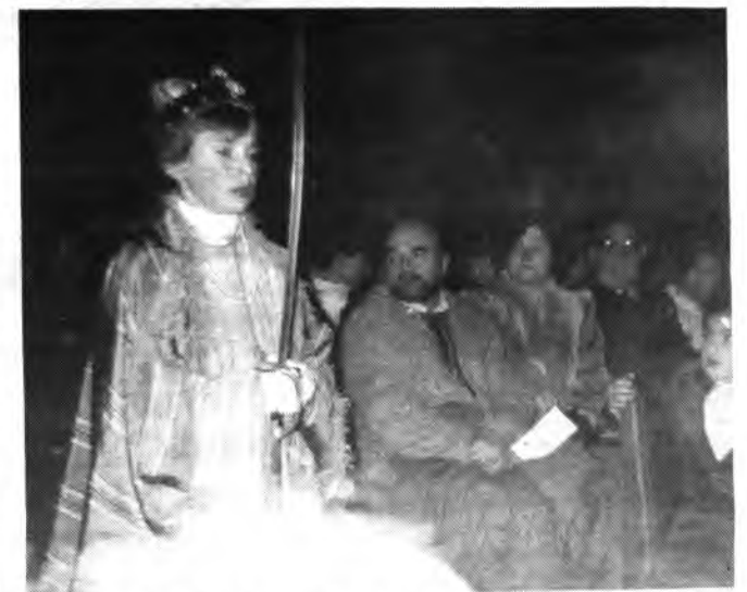
Nadal de Lluc a la Seu de Mallorca.