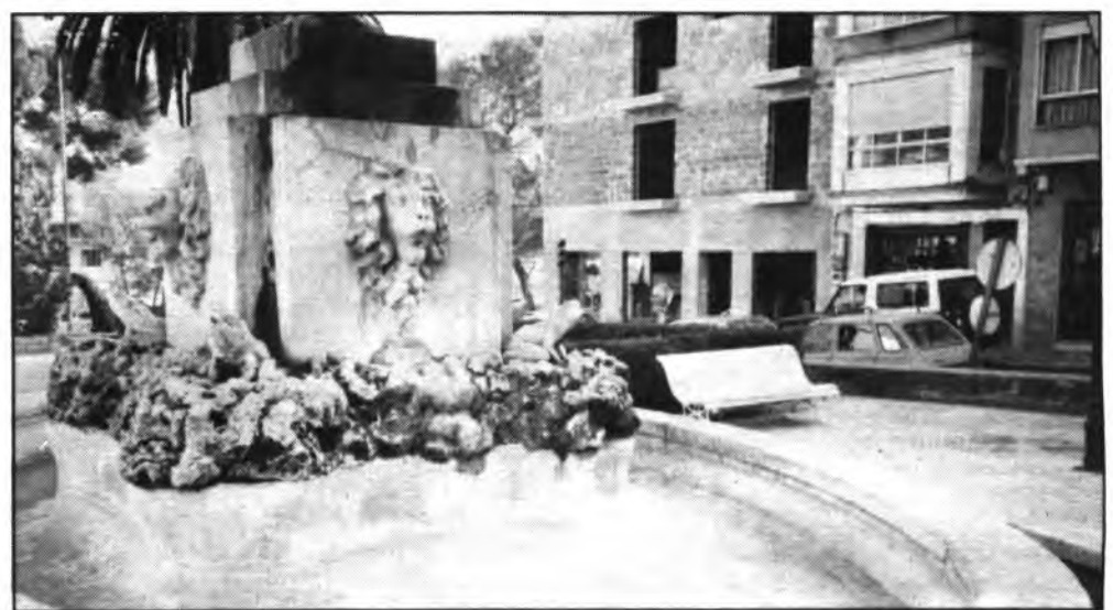
La fuente de la Plaza de Oriente en «paro». (Foto: ANDRES QUETGLAS).

En consecuencia, en fecha próxima, la Avinguda de Alcudia será objeto de este arreglo y con ello una vez por todas se solucionará el problema del bache existente en la acera de la Avinguda. Así pues, los vecinos de la barriada de Es Cos y más concretamente los vecinos de la Avinguda de Alcudia pueden estar tranquilos, pronto, muy pronto