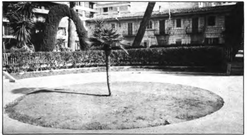
La Plaza de Mallorca en estado de abandono.