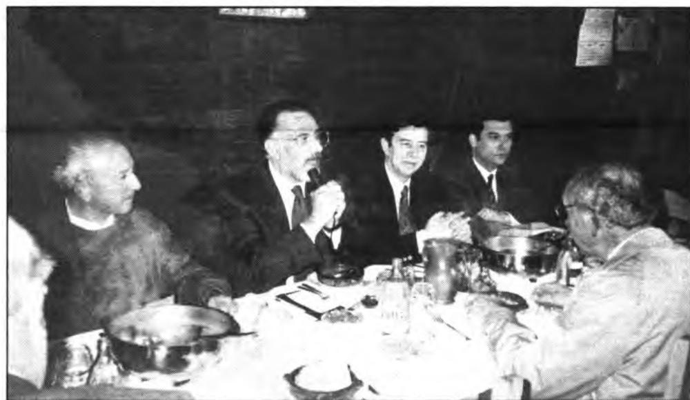
El Conseller Pere J. Morey, mantuvo un interesante coloquio con los representantes de los Medios de Comunicación de la Part Forana.

El "Pla de Desenvolupament del es Zones Rurals a les Balears. 1991-1993" es un programa de la CEE con el objetivo de desarrollar diversas zonas de las islas sin apenas incidencia turística, situadas en la denominada agricultura de montaña, y conseguir unos objetivos que incrementen las rentas generadas por al actividad agraria, mejorando las estructuras de producción, haciendo especial referencia a la disminución de costes.