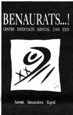
Portada del libro.

—Pienso que es muy importante la labor que se ha