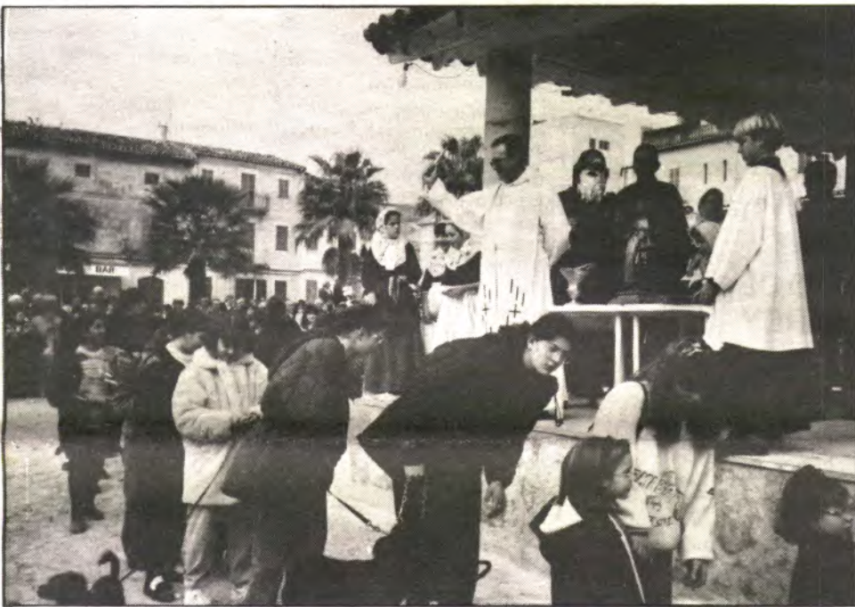
CONCURRIDAS "BENEIDES DE SANT ANTONI"