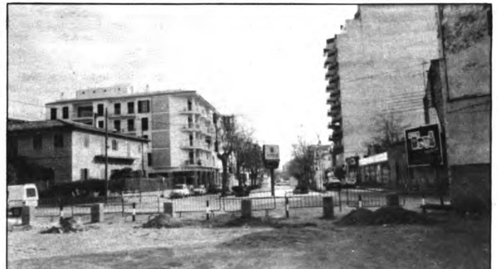
Sa Quartera, cerrará al tráfico y futuro aparcamiento.