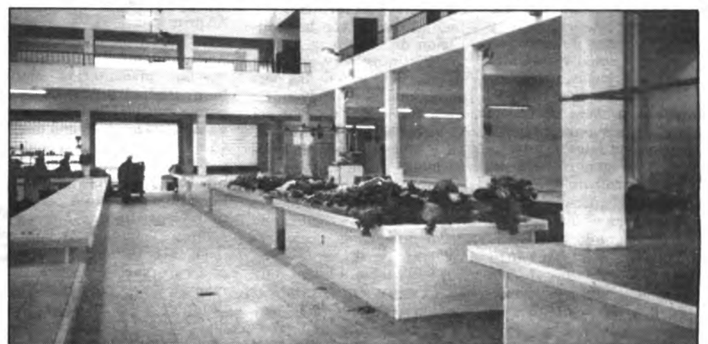
Puesto de venta y nula presencia de compradores.

CLINICA OTORRINOLARINGOLOGIA DR. JOSE A. COLOMER GOMEZ