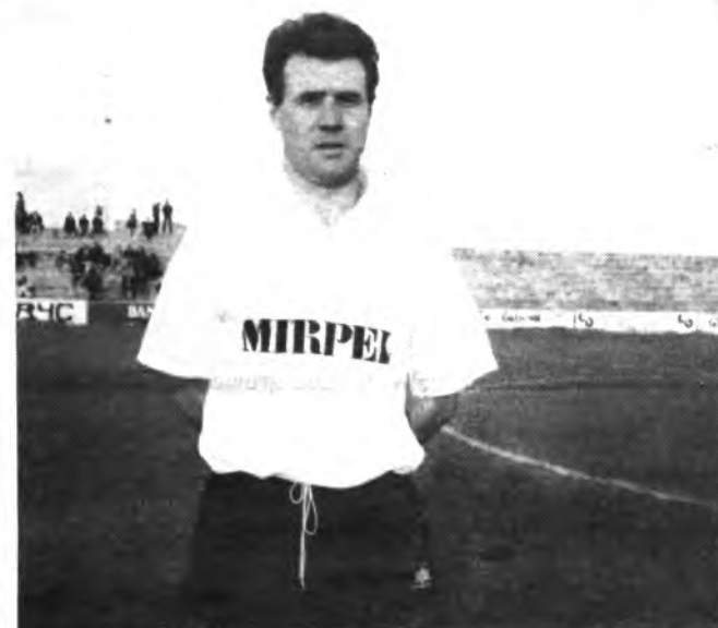
Corró, cuajó una buena actuación.

En definitiva, segunda salida consecutiva del cuadro de Inca y segundo empate consecutivo lejos del Nou Camp de Inca.