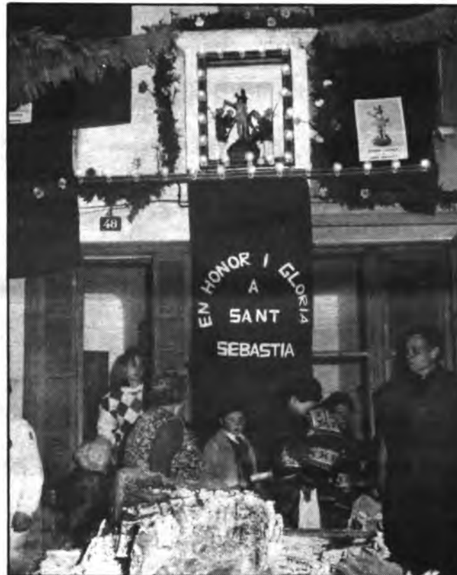
Un año más, Inca celebró la «Festa de Sant Sebastià».

En diversas ocasiones, se ha venido criticando el es-