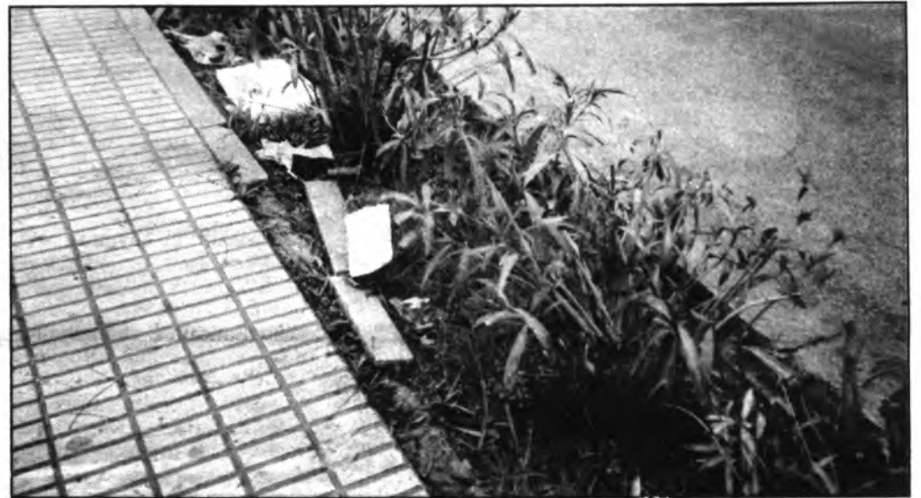
Suciedad y bordillos rotos en la Gran Vía.