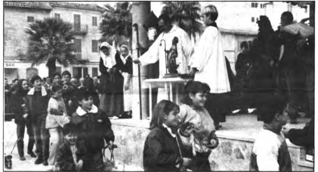
«Beneides de Sant Antoni», todo un éxito de participación.

El pasado sábado por la mañana, en la Plaza Des Bestiar, se celebraron las tradicionales beneides de Sant Antoni. Las mismas se vieron muy concurridas,