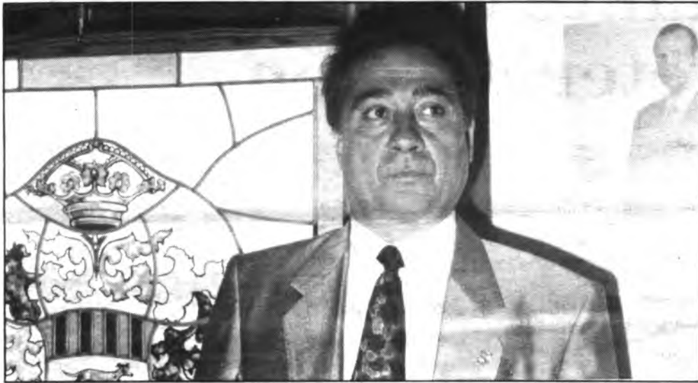
Jaume Armengol, asegura obras de alcantarillado en la Avinguda de Alcudia.

Tras las reiteradas protestas de los vecinos de la Avinguda de Alcudia, con relación al agujero existente en la acera y a la altura del establecimiento comercial PADUFI. El alcalde de INCA, Jaume Armengol, en entrevista exclusiva a DIJOURS, ha clarificado los distintos puntos que han determinado el actual estado de cosas.