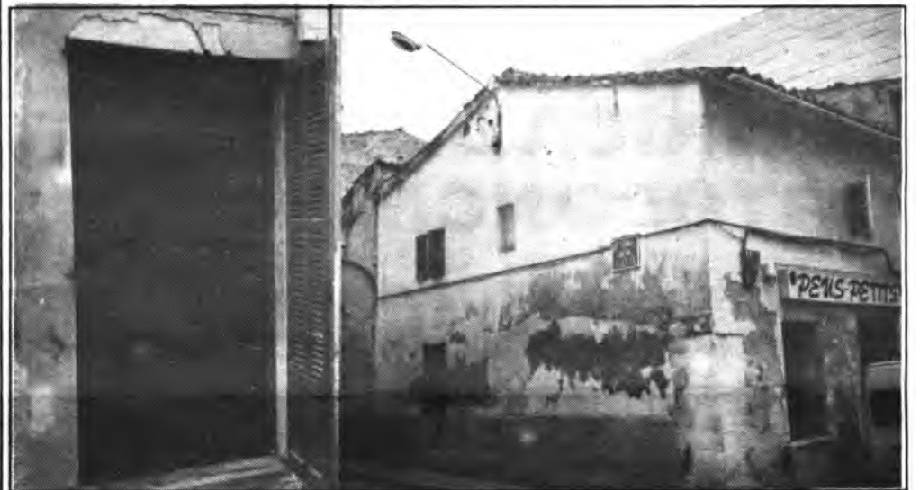
Lamentable estado de abandono presenta la casa de la calle de San Francisco.

La fotografía que hoy acompaña nuestro comentario, no tiene otra finalidad que denunciar el estado de abandono en que se encuentra una casa de la calle San Francisco, esquina de la calle Virtud.