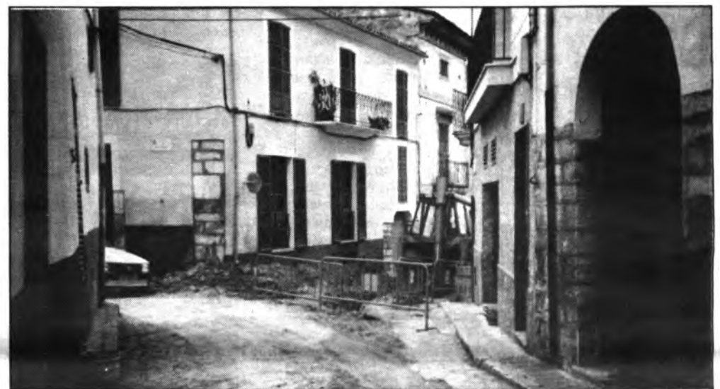
Se reanudaron los trabajos en las alcantarillas de la zona de San Francisco. (Foto: A. QUETGLAS).