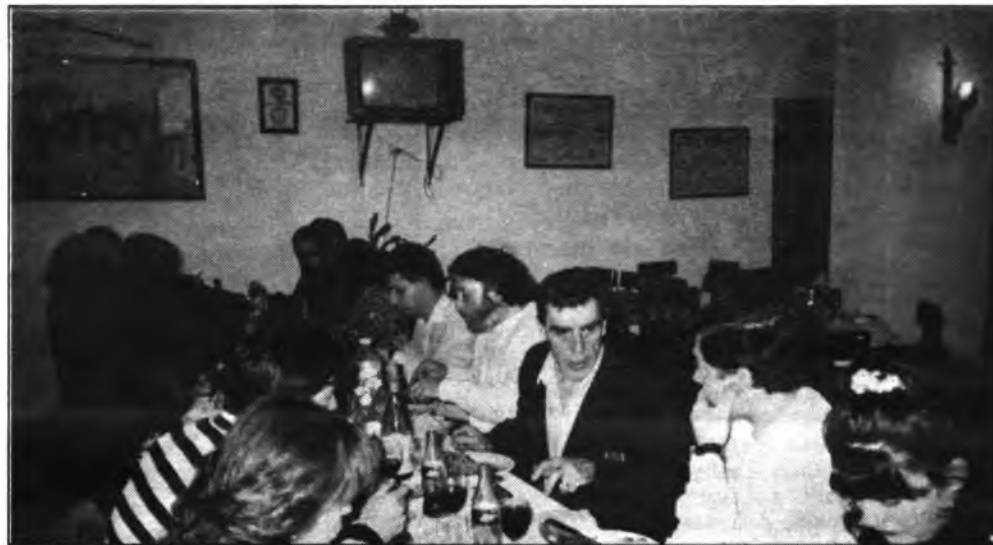
La cena de compañerismo, uno de los alicientes de la confrontación. (FOTO: ANDRES QUETGLAS).