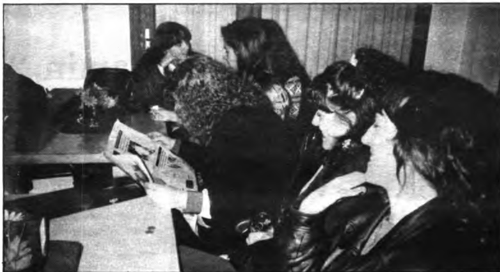
El Semanario Dijours, protagonista en la gran velada del billar. (FOTO: ANDRES QUETGLAS).