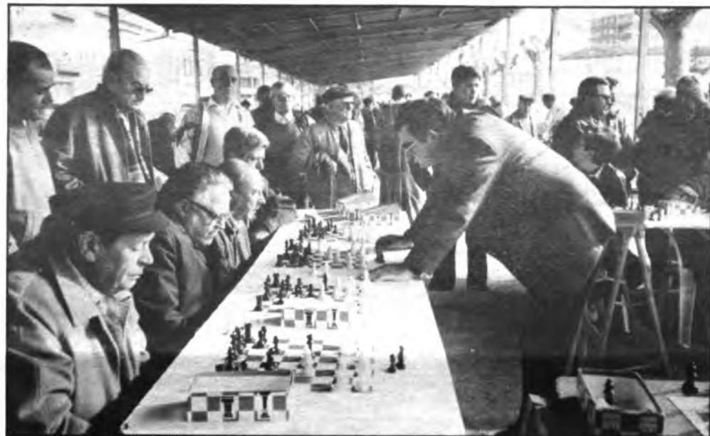
Simultáneas de ajedrez en la Plaza «Des Bestiar».

Bar Sa Trobada Comunica a sus clientes y en general, el cambio de Dirección y la reapertura del Servicio de Hamburgueseria, Sandwichería y platos combinados.