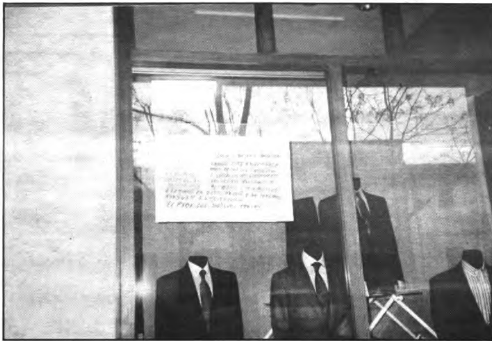
Los vecinos de la Avinguda de Alcudia siguen protestando.

Evidentemente, Busquets, es un hombre que