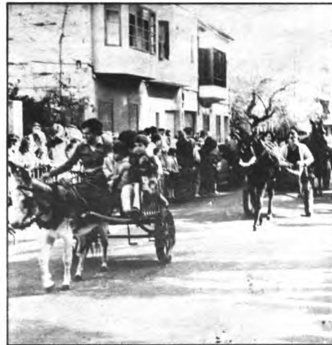
Mañana fiesta de Sant Antoni.

Si en otras ocasiones, se colocaron carteles de protesta en las barreras de protección del agujero. Ahora, los vecinos, han colocado carteles dirigidos al consistorio dentro de los propios escaparates del estableci-