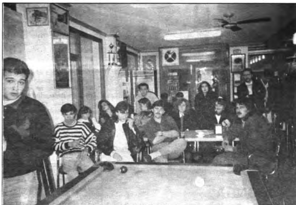
Numeroso público, presenció el desarrollo de las partidas.