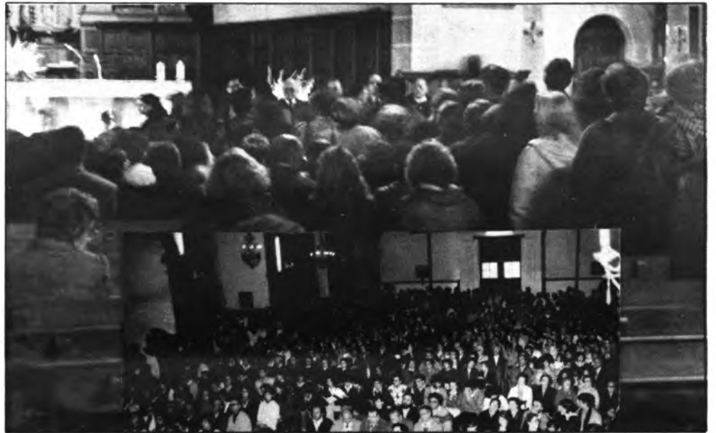
Impresionante manifestación de duelo en las parroquias de Santo Domingo y Sta. María la Mayor.