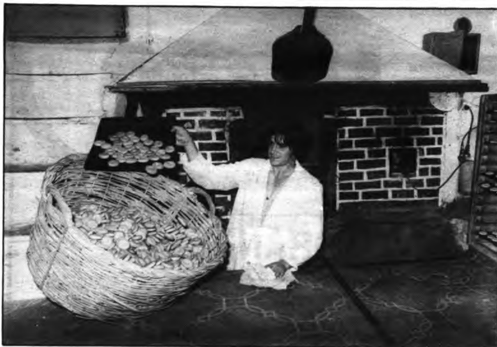
Ejemplo de la antigua fabricación artesanal de las galletas de Inca (FOTO: Archivo ANDRES QUETGLAS).

¿Quién no ha comido alguna vez una galleta de Inca, ha untado la sobrasada, el paté... sobre la misma y quién no ha merendado con una galleta y un trozo de chocolate o sencillamente acompañada tan sólo de un corro de aceite?. La respuesta, con toda probabilidad, es que casi nadie ha