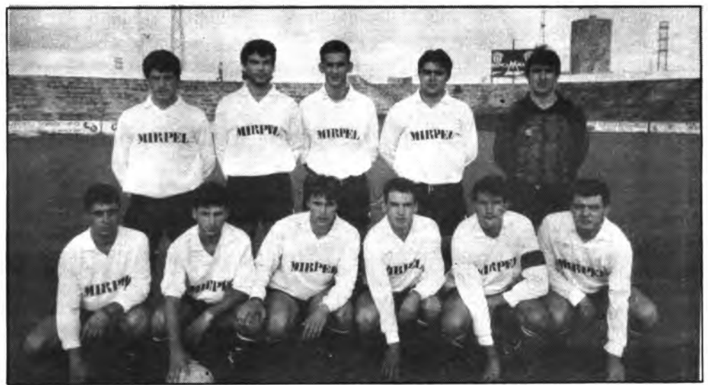
Equipo del Constancia.

Lo que no se puede pretender es grandeza esperando que ésta venga del aire. Hoy, el Constancia, sigue en pie de guerra, gracias al esfuerzo reiterado de un reducido puñado de en-