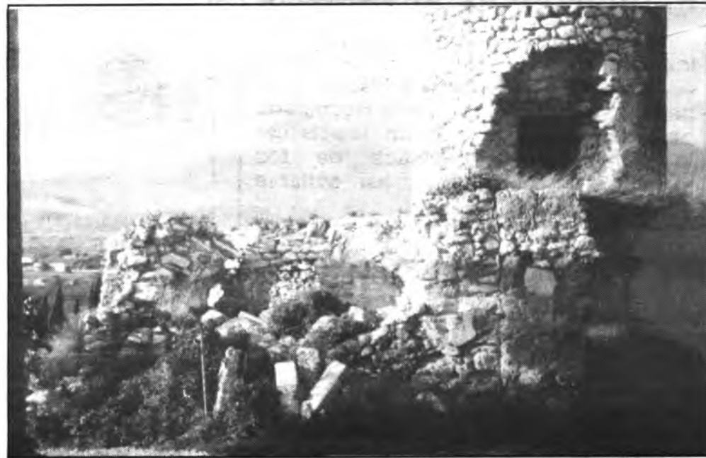
Molinos del Serralt. (FOTO: ANDRES QUETGAS).

Los molinos del Serralt de Ses Monges Tancades, en la actualidad, han desa-