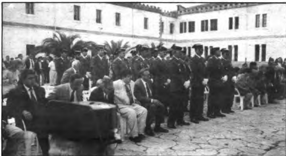
Se sigue trabajando en las negociaciones para recuperar el Cuartel Gral. Luque. (FOTO: ANDRES QUETGLAS).

dos a la asociación de la tercera edad de Inca y comarca, que se mostraban totalmente descontentos y disconformes con el trato que recibían.