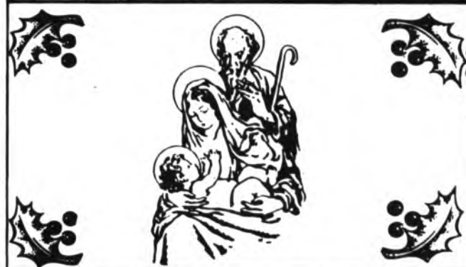
Los Reyes Magos de Oriente, anuncian una vez más su llegada a la ciudad de Inca.

Efectivamente, se dijo que muy posiblemente se desplazaría este representante del Ministerio de DEFENSA, y a buen seguro que el mismo se desplazará cuando las fiestas de Navidad y Año Nuevo sean un recuerdo. En este aspecto, amigos lectores cabe tener confianza y no precipitar un tanto demasiado las cosas. En este asunto, parece ser que se pisa tierra firme y se sabe orquestar el ritmo adecuado. Por lo tanto, seamos optimistas y dejemos trabajar con tranquilidad a las personas que cargar con la responsabilidad de llevar a cabo tan importantes gestiones.