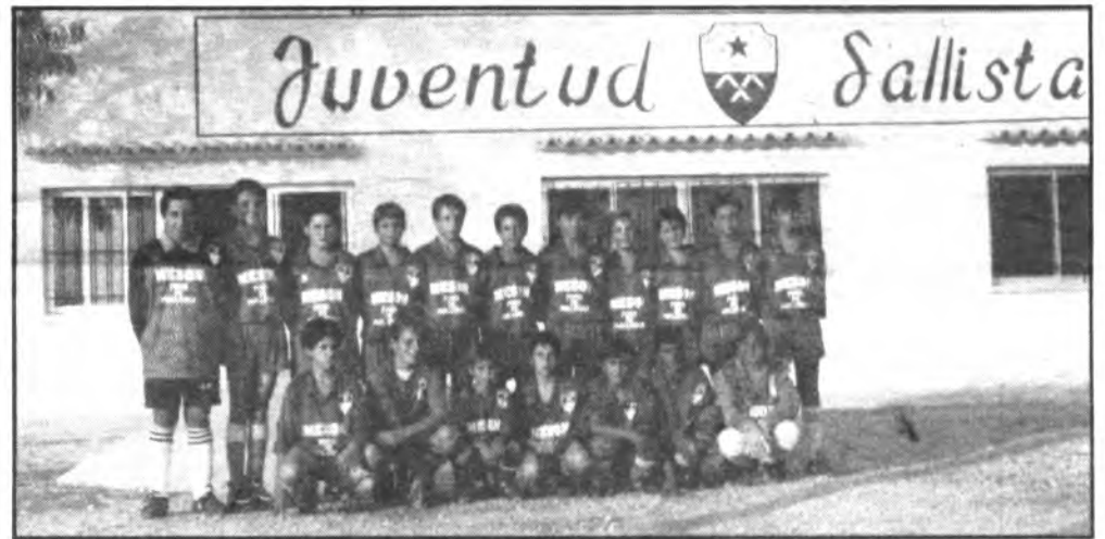
Equipo Infantil del Sallista.