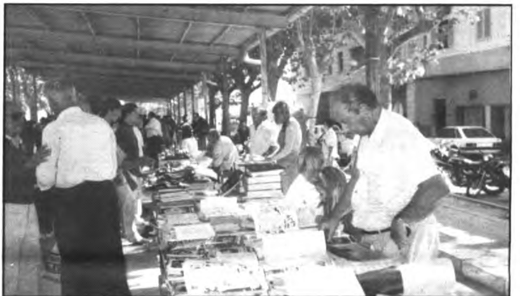
El RASTRO de Inca, todo un éxito.