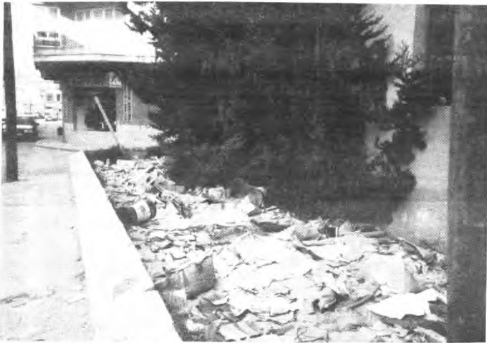
Aspecto del vertedero de basuras en la calle Vte. Enseñat. (Foto: ANDRES QUETGLAS).

En los dos últimos lustros, la calle de Vicente Enseñat, ha experimentado una total transformación al haberse edificado numerosos edificios. Con ello la referida calle hoy presenta una imagen mucho más modernista que la que nos presentaba hace tan solo unos