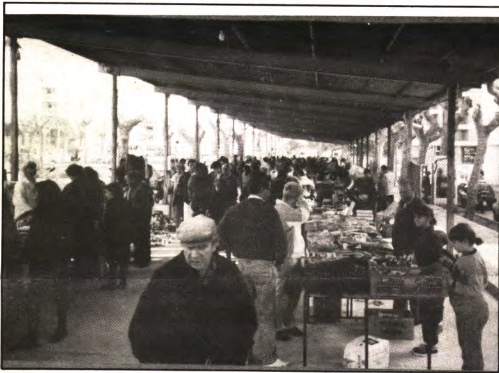
«EL RASTRO» LA CONSO- LIDACIÓN DE UNA INICIATIVA