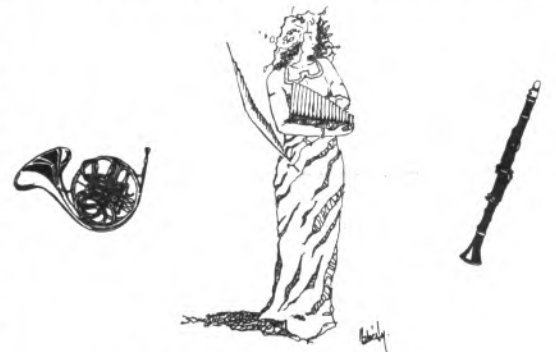
LLETRA: Mn. Pere-Joan Llabrés i Martorell. DIBUIX: Sebastià Llabrés i Munar. MUSICA: Miquel Genestra i Alomar i Sebastià Llabrés i Munar

Puix als músics feis de guia, oh Cecília, amb honor: cantarem amb harmonia Déu, la Pàtria i l'Amor