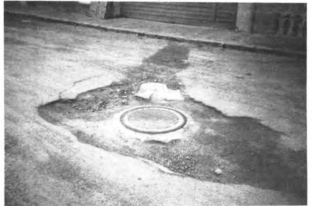
Enormes baches, se pueden apreciar en la calle Vte. Enseñat.

Ahora bien, esta avalancha de edificaciones, esta fiebre en construir apresuradamente, igualmente se deja notar en el aspecto negativo de la calle. Las consecuencias se encuentran a la vista de todo ciudadano, peatón o conductor. Joven o viejo, ya que no es necesario