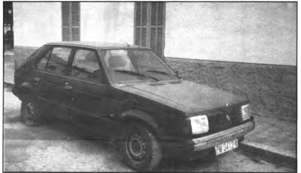
El vehículo lleva más de un año abandonado en la calle J. Herrera.