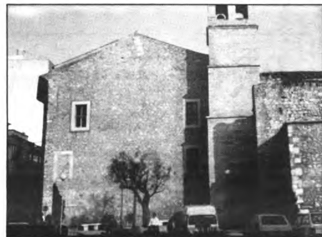
La barriada Des Blanquer, será una fiesta el próximo sábado..