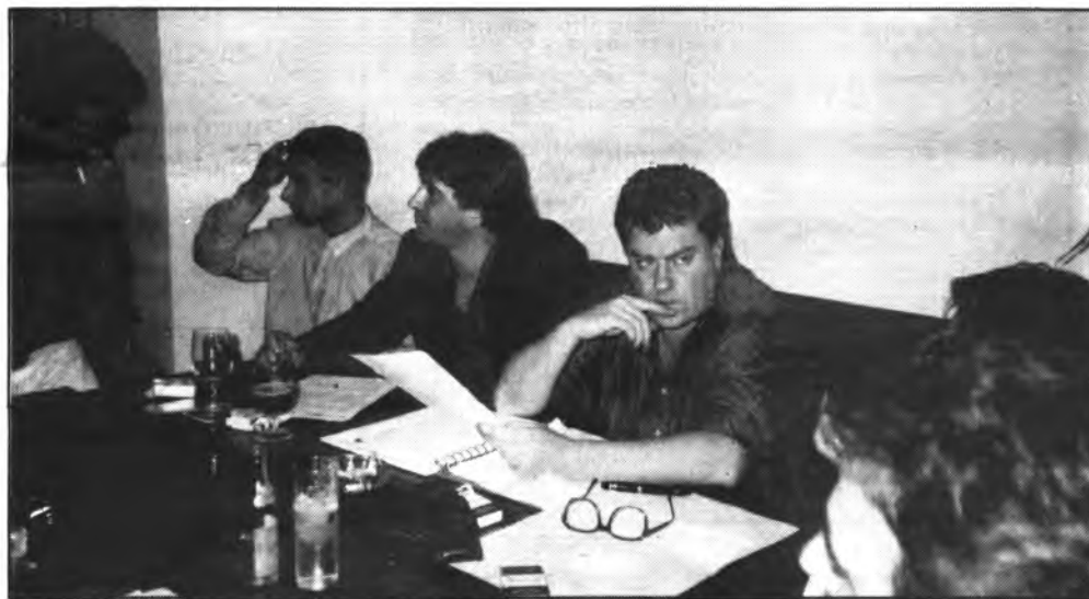
Tras laboriosas gestiones, los representantes de los Pubs de Inca, organizan un sonado festival.

En la próxima edición, retornaremos con la actualidad que gira en torno a este concierto ya popular incluso mucho antes de celebrarse.