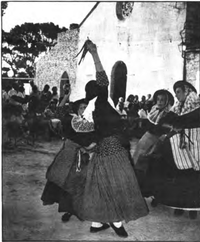
Actuación de los Revetlers des Puig d'Inca.

Finalizado el acto religioso en la explanada de la