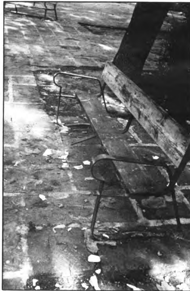
Persiste el mal estado de la plaza Blanquer.

En otro orden de cosas, pero siguiendo dentro del capitulo de denuncias no atendidas, refrescaremos la memoria de nuestros queridos y estimados lectores y con ello de alguien con voz y voto en la cuestion que nos ocupa y que no es otra que la denuncia del vehiculo abandonado desde hace más de medio año en la calle Juan de Herrera. Nuestra denuncia fue publicada con foto incluida en estas páginas. Pero pasaron los dias, las semanas y