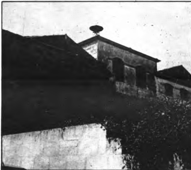
Detall de la fabrica Melis.

El nombre de tallers s'establitzà fins a l'any 1936, però un cop començà la Guerra Civil, que estimularà la demanda de calçat per l'exèrcit, els tallers tornaran a multiplicar el seu nombre i el seu volum de ventes. Passam dels 18 tallers amb +- 600 operaris declarats al 1934, als 48 tallers amb +- 2000 operaris declarats al 1941. Els volums de