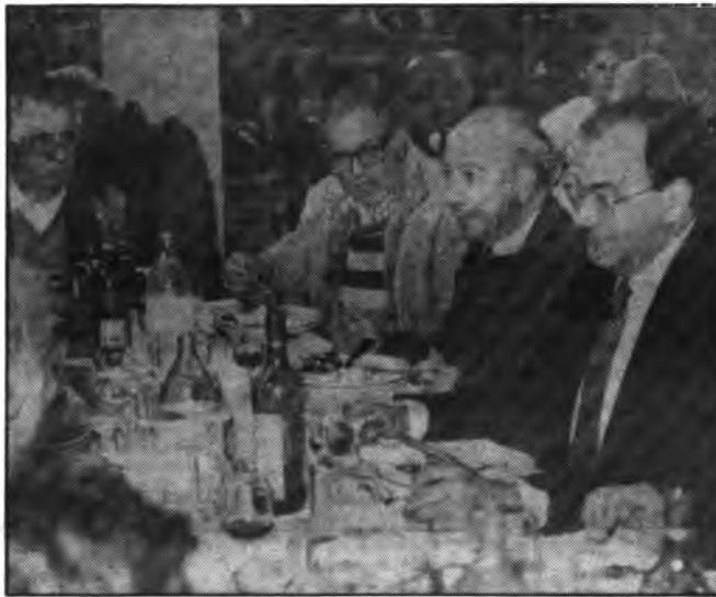
El presidente del CIM junto con el presidente de Prensa Forana.