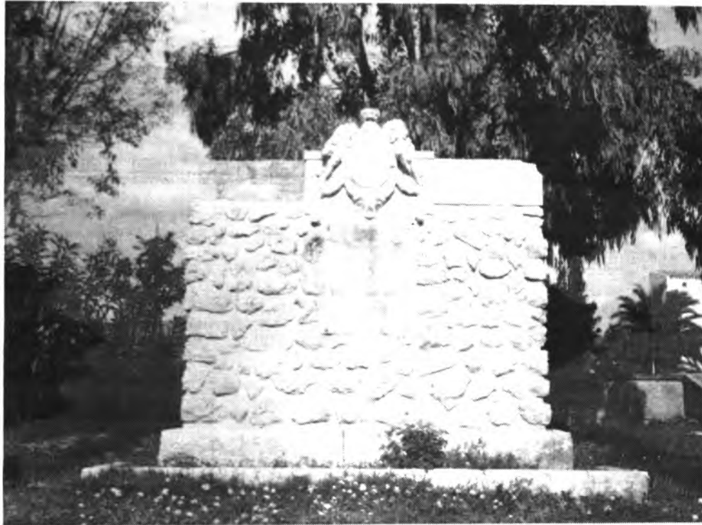
Estado lamentable del monumento dedicado al batallón de Inca.

En otro extremo de la ciudad, calle Obispo Llompard, se encuentra ubicado el monumento que en el año 1952, la ciudad de Inca de-