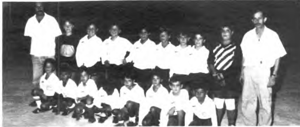
Equipo Benjamín SALLISTA ATL.

Con la suma de estos dos puntos, el Sallista continúa ocupando el segundo puesto