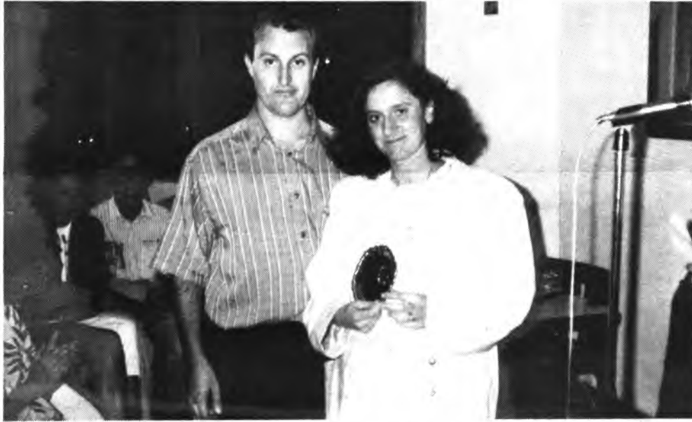
Hubo obsequios para los representantes de los medios de comunicación.