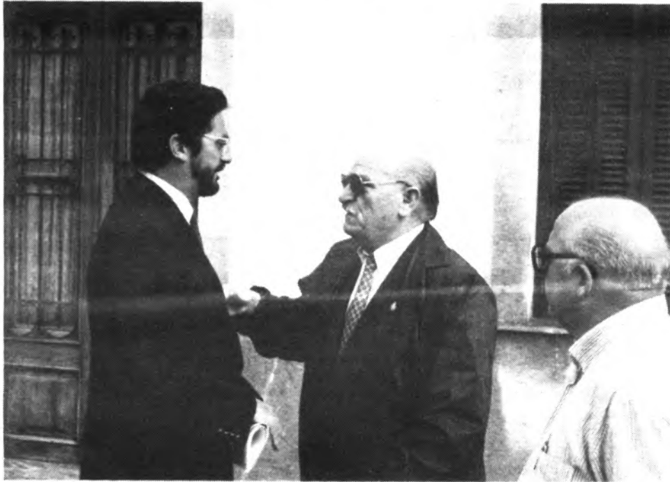
El Delegado del Gobierno visitó las zonas afectadas

Nuestra ciudad alcanzó el protagonismo informativo en la tarde-noche del pasado martes, debido, como es del dominio general, a las intensas lluvias que azotaron la zona central de la isla, como el día anterior había sucedido en la zona norte.