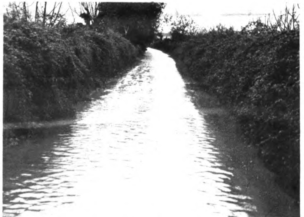
«Camís des Rasquell» era un torrente.

El Ayuntamiento, cuartel general de toda la operación, estaba atendido