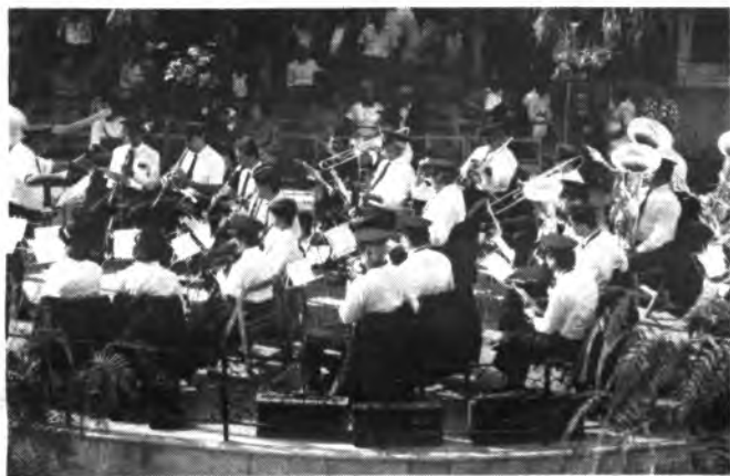
La Banda d'Inca l'any 1987 a un concert de Les Fires a la llotja de la plaça d'Espanya.

El dissabte passat, en motiu del Congrés socialista de Mallorca que es va celebrar a la nostra ciutat, va actuar la Banda d'Inca a n'el Campet d'es Tren, realitzant un petit concert baix la direcció de Vicenç Bestard. El dia següent, la mateixa Banda va realitzar una altra funció al poble de Biniamar, en motiu de les Festes de Santa Tecla.