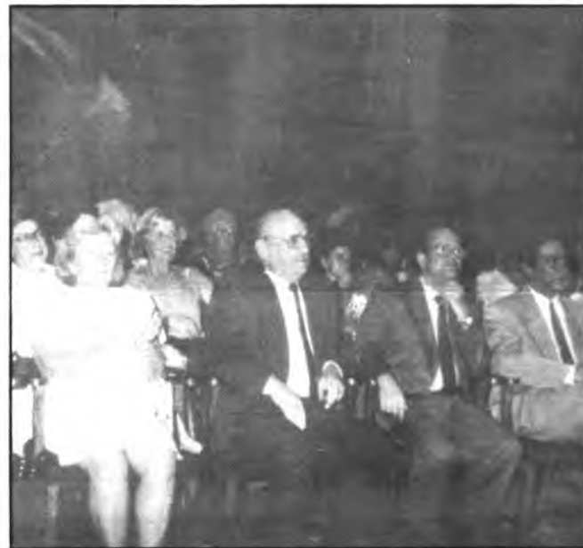
Autoridades presentes en el acto.

Ocupaban el primer banco de los asientos el al-