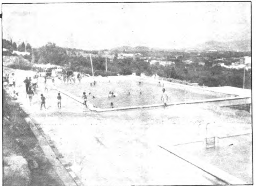
Las dos piscinas públicas de Lloseta entraron en funcionamiento.

Con la puesta en funcionamiento del segundo