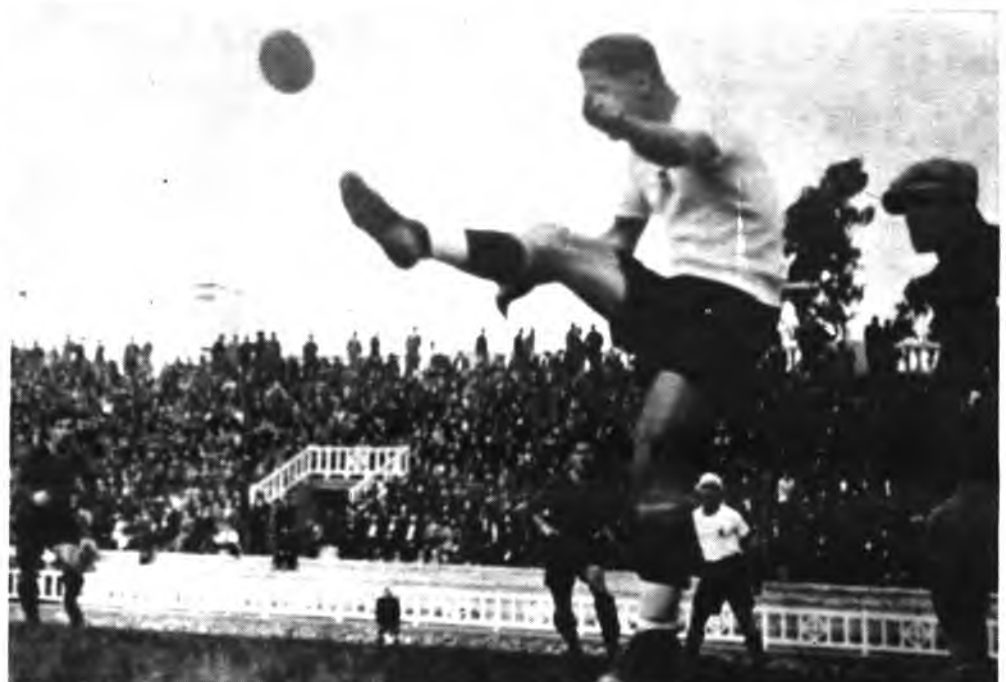
El defensa, despeja un balón en el Campo de Las Corts, en el partido de Copa, frente al C.F. Barcelona.

Desde el balcón de la Casa de la Villa el presidente hizo ofrecimiento del título a la ciudad, en la persona del señor Alcalde. Hubo