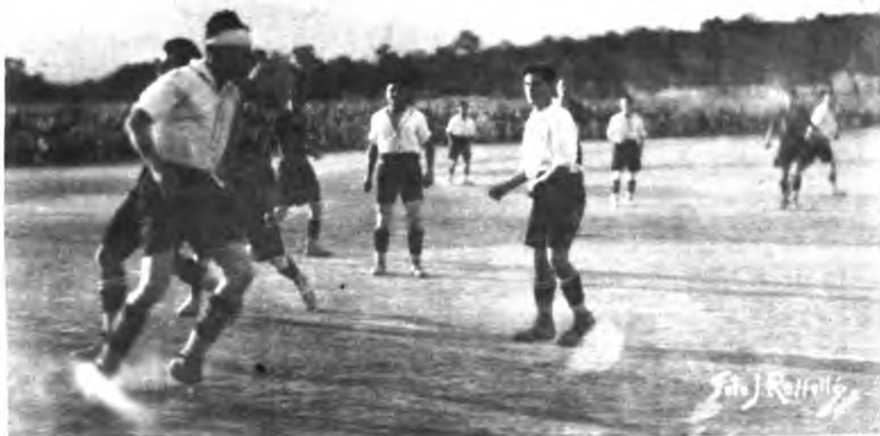
El Campo Des Blanquer, escenario del primer Constancia-Alfonso XIII.