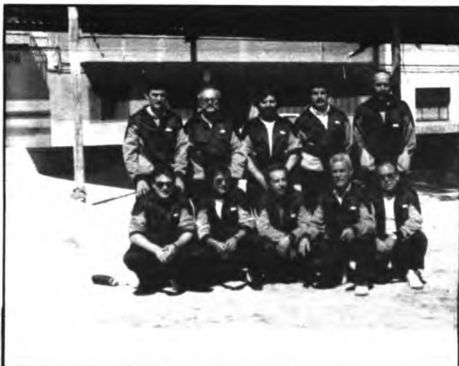
Club Unión Petanca Inca.