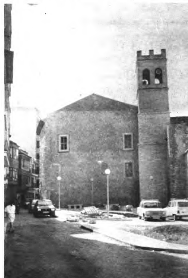
Después de la reforma.

Si de verdad existen problemas entre vecinos y Ayuntamiento, pues este es tema que no nos vamos a ocupar, toda vez que mi deseo no es otro que manifestar que el entorno de las calles Almogavares y Biniamar, se ha visto enriquecido con la obra y reformas llevadas a cabo. Unas obras que han cambiado por completo la imagen de las referidas calles. Ayer, auténtico basurero de la barriada y refugio de roedores. Hoy, la