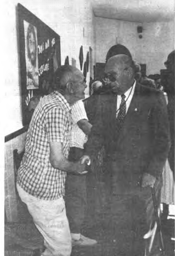
109 millones, presupuesto de la residencia Miguel Mir. (Foto: ANDRES QUETGLAS).

El Claustro de Santo Domingo, fue escenario de la