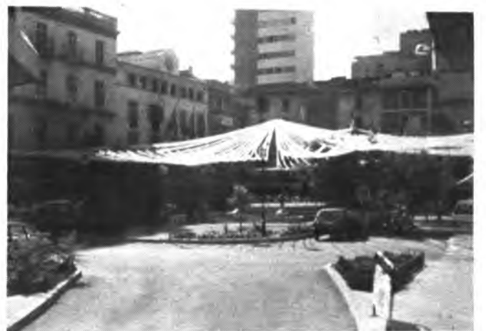
El PAPERI y las banderas, siguen adornando el Carrer Major. (FOTO: Andrés Quetglas).