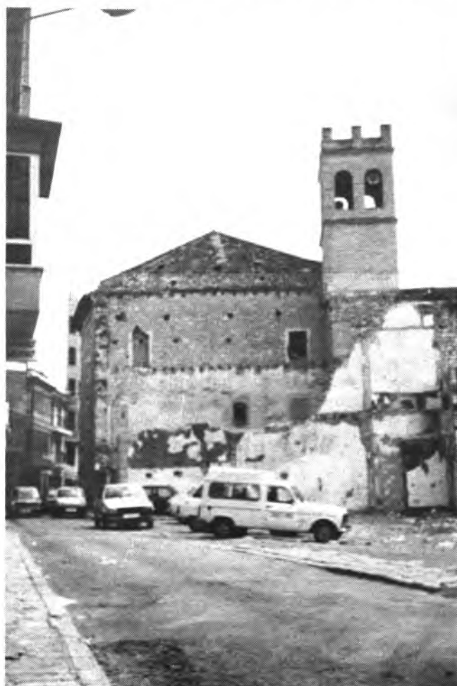
Antes de la reforma. (FOTO: Andrés Quetglas).

Amigo lector. Estimado ciudadano, en el corto espacio de dos años, habrás tenido oportunidad de enterarte de las circunstancias que han rodeado la reforma de la populosa calle de la barriada de Santo Domingo y conocida por Almogavares.