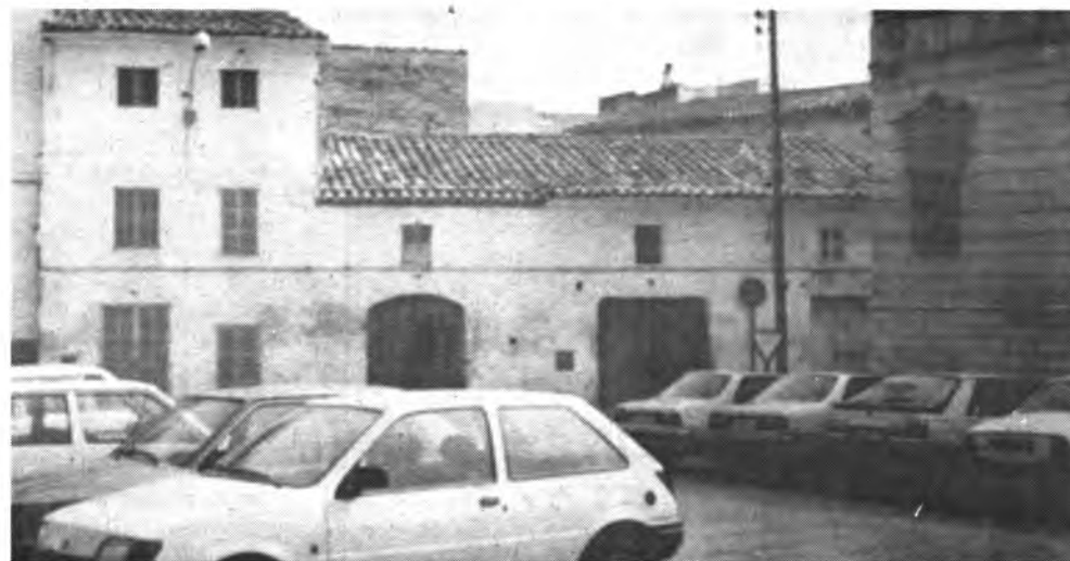
La Gran Vía de Colón, se unirá con la Plaça de Sa Quartera.