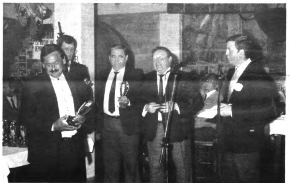
Junto a los deportistas, se homenajea a los veteranos ex directivos y responsables del deporte local.

M'interessa una subscripció ANUAL al preu de 2.000 pts. i amb la forma de pagament següent: