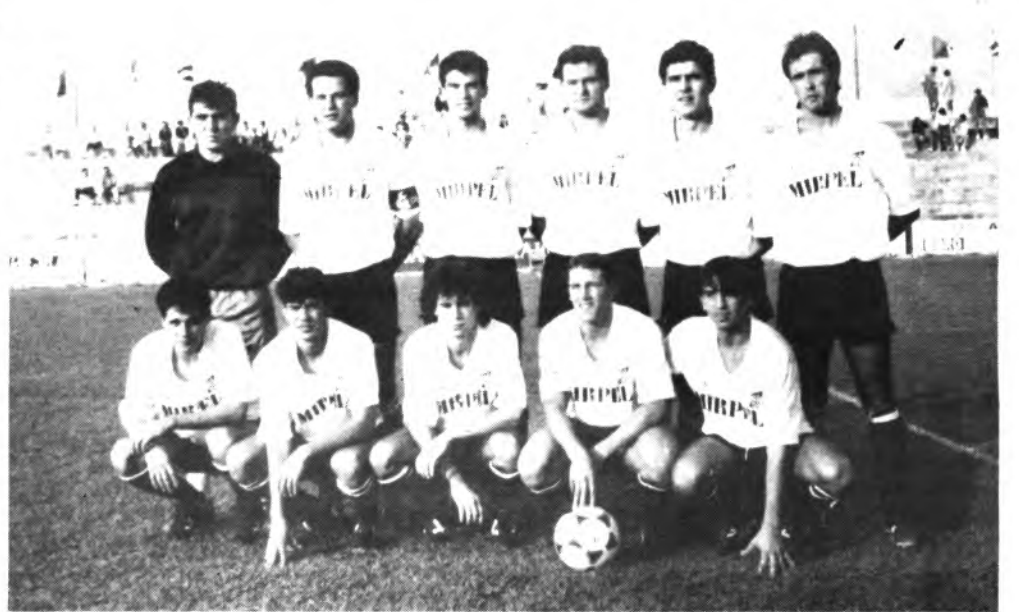
Equipo del Constancia.