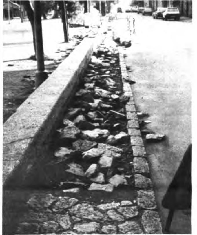
Las aceras de la Avenida de Reyes Católicos, han sido objeto de mejora. (FOTO: ANDRES QUETGLAS).

semanario información local y comarcal dijous