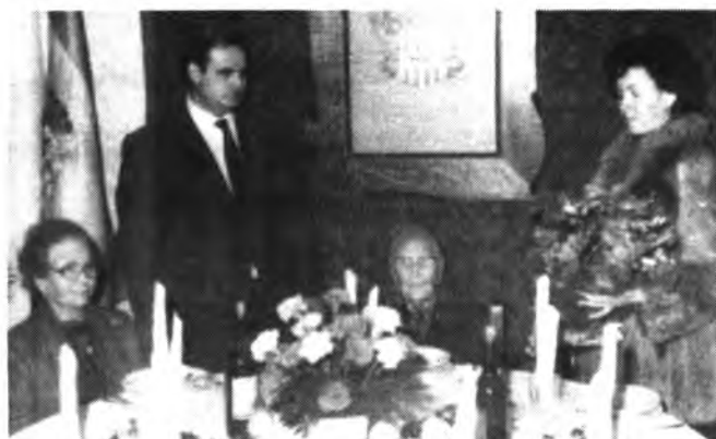
Sa Padrina d'Inca, junto a sus familiares más allegados.

A la familia Seguí-Capellá, nuestro más sentido pésame asociándonos a su dolor.