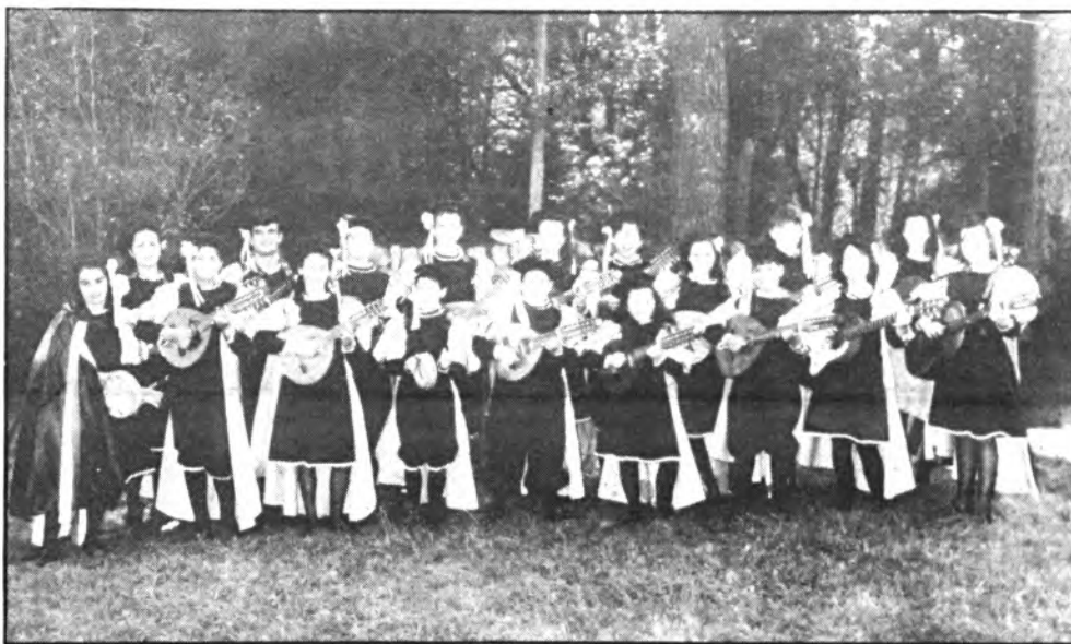
Tuna Juvenil Cunium.