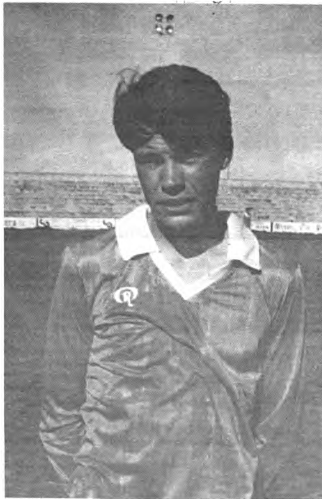
Tolo, no pudo evitar la derrota de su equipo.

juego estuvo muy nivelado, imponiéndose las defensas a los delanteros contrarios llegándose al descanso con el empate inicial.