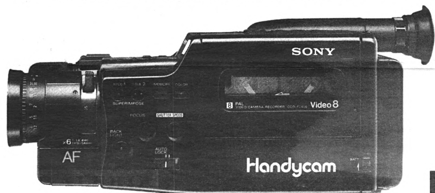
F340 El poder sobre la imagen