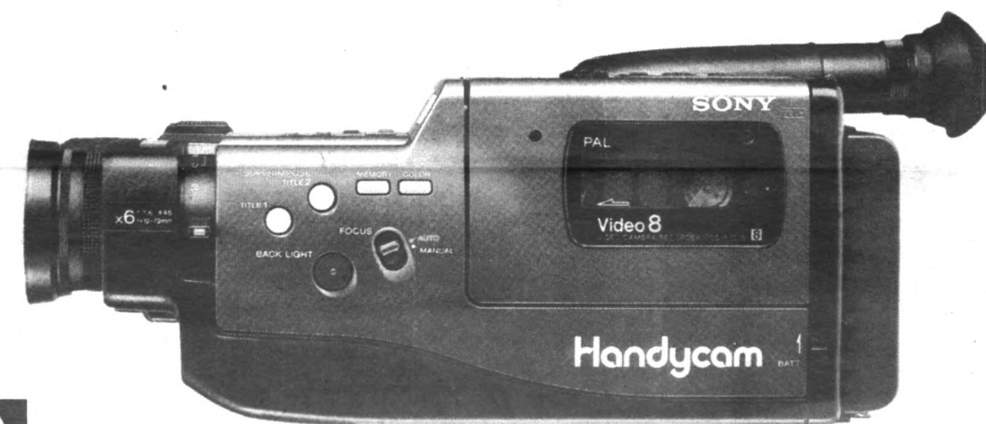
F330 Dos veces sobreimpresionante