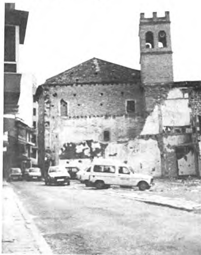
Calle Almogávares, objeto de polémica y malestar.

El tema es de sobras conocido y comentado. Estos días, las diferencias entre Ayuntamiento y vecinos de la calle Almogávares han sido ampliamente aireadas tanto a nivel de calle como a nivel de prensa y radio.