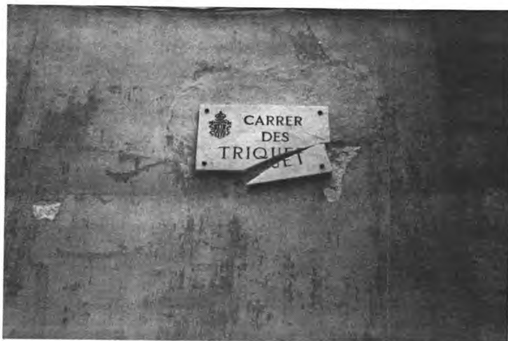
Los desperfectos, día a día van en aumento.

margen, vive un ambiente de destrucción, de degradación y de poca sensibilidad por y para las cosas bien conservadas y bien cuidadas. Da la impresión, que a un elevado número de personas, les gusta, e incluso disfrutan con el desorden, y la suciedad. Menospreciando la convivencia agradable, que es como de-