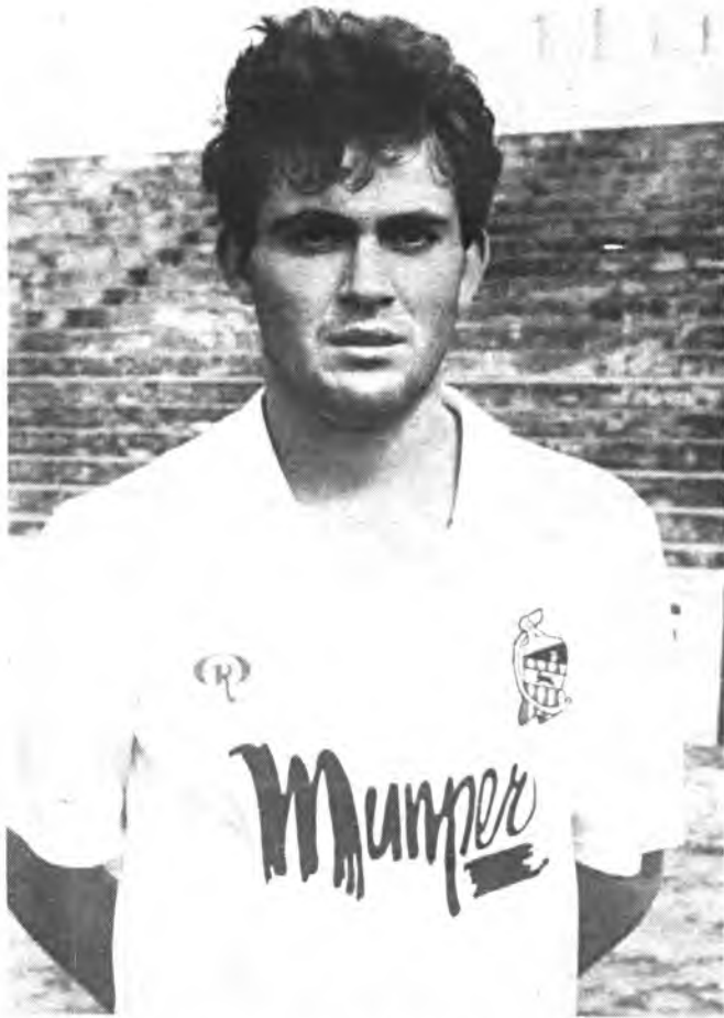
Mut, autor de dos goles.

Pobre espectáculo el que ofrecieron los equipos del Constancia e Isleño, en una confrontación en que tan solo la marcha del marcador, mantuvo vivo el interés de los espectadores.