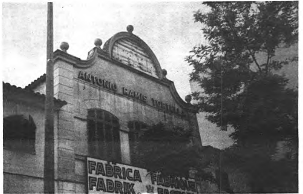
Fachada de la fábarica.