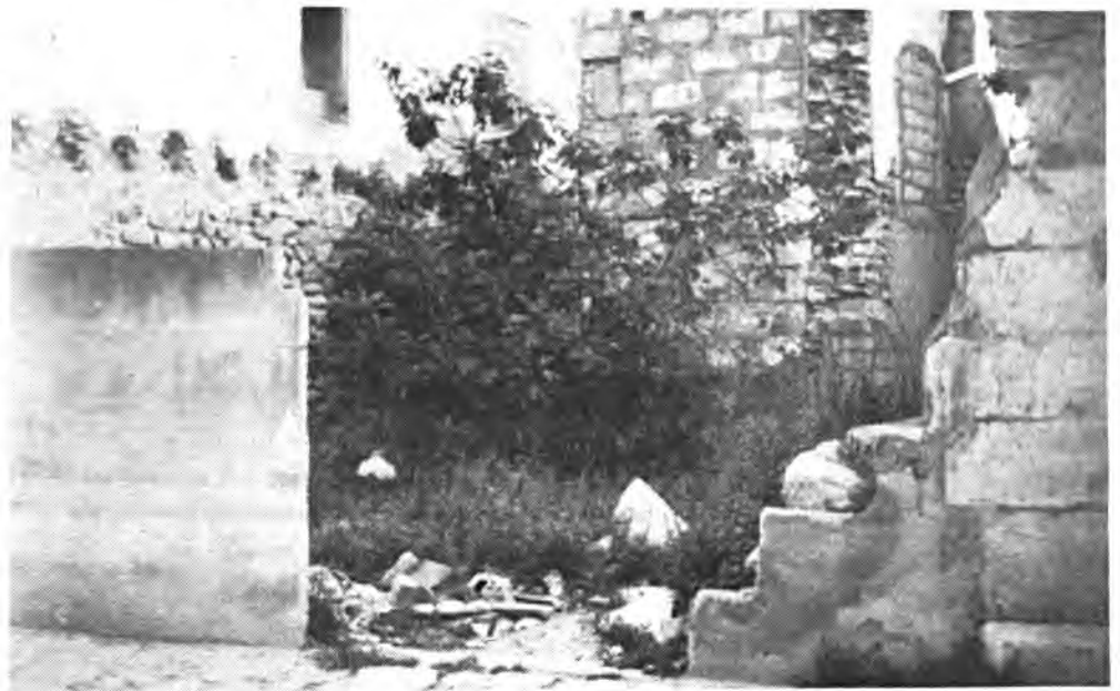
Solar semi-vallado, de la calle Biniamar.

Biniamar, de gran tránsito de personas y coches, hace que su presencia sea comentada con mayor énfasis por los ciudadanos que no acaban de comprender como se sigue tolerando la supervivencia de un solar en tan lamentables condiciones.