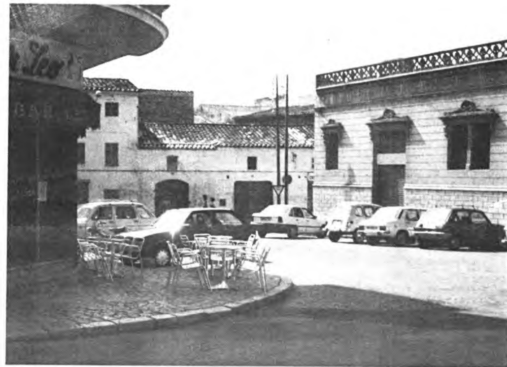
Sa Quartera, hasta aquí, llegará la Gran Vía de Colón.

Es evidente que una obra de esta envergadura, dará una nueva imagen urbanística de nuestra ciudad, toda vez que la prolongación de la Gran Vía de Colón hasta el centro de la ciudad que es Sa Quartera, dará un sentido desconocido de la urbe inquense, desapareciendo buena parte de unos solares abandonados, y unos inmuebles casi en ruinas,