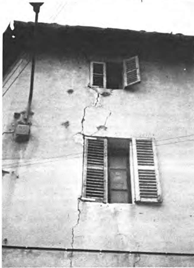
Se nos cae el viejo cuartel.

Per la transcripció: Gabriel Pieras Salom