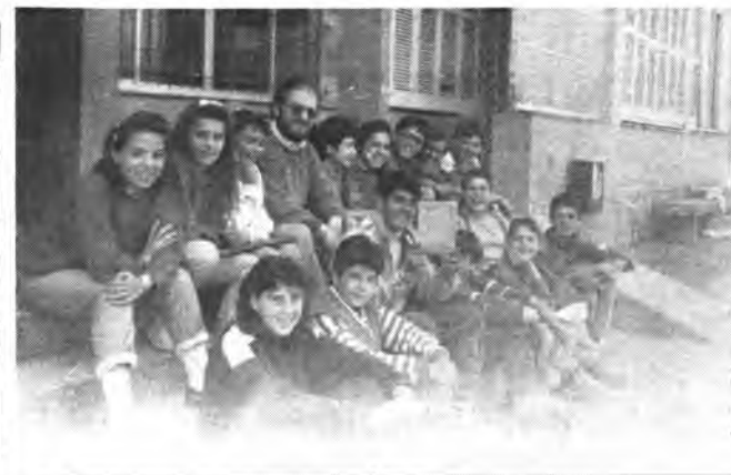
Grupo de escolares del Colegio Ponent.

Está programado que dichos cursillos finalicen mañana, viernes, en el Puig d'Inca con una puesta en común, cena y celebración.