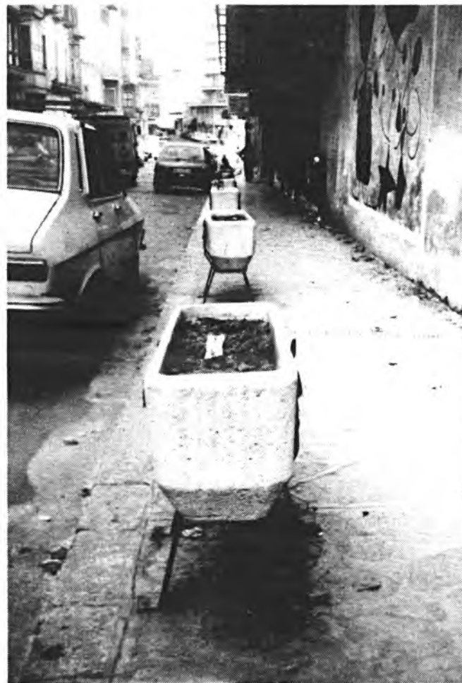
Estado deplorable en que se encuentran las jardineras de la calle Bisbe Llompart.