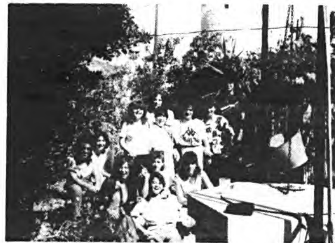
El Curs de Nateja, cuenta con aceptación.

Las clases se imparten en unos locales que la Parroquia de Santa María la Mayor cede para este fin. Se pretende que estos cursillos sean una salida laboral para un cierto sector poblacional (femenino en su mayoría) que necesita prepa-