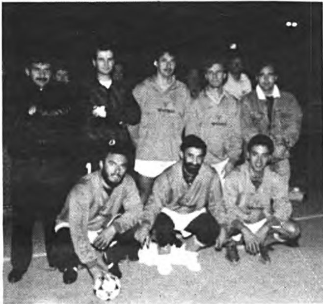
Equipo de Calz. Yanko.