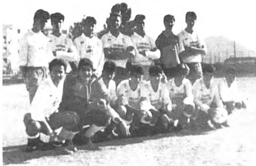
Equipo juvenil Bto. R. Llull.