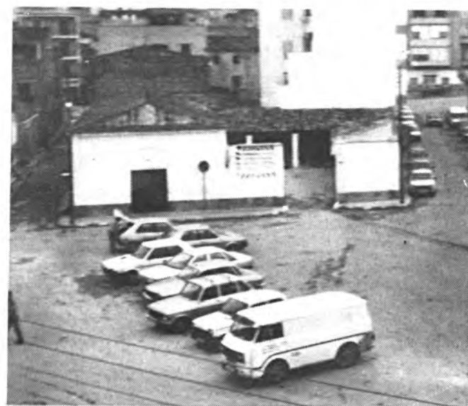
Los Juzgados siguen retrasándose.