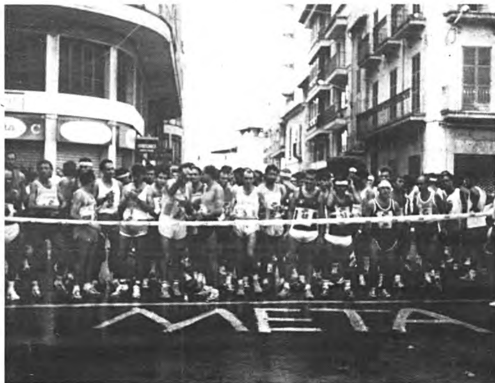
Más de doscientos atletas, en la V San Silvestre de Inca.