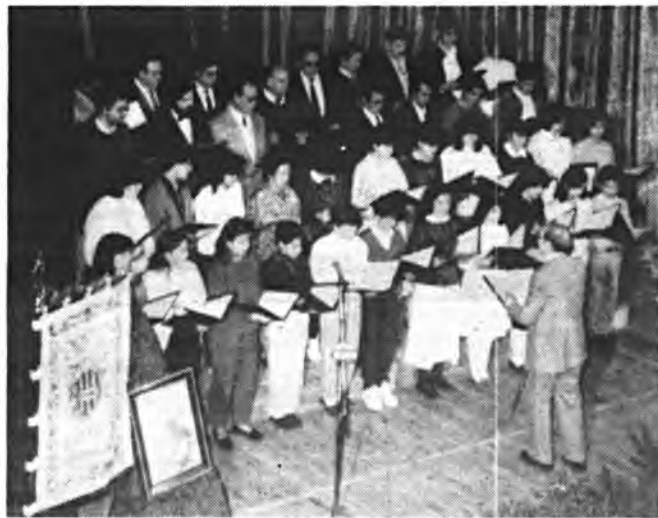
L'Harpa d'Inca, estrenará vestuario.

El concierto de este sin duda será el más importante de los que se han venido celebrando hasta ahora, ya que juntamente con el orfeón inquense, estarán presentes en el mismo las bandas de Música Unión Musical Inquense, y Banda de Alcudia, junto con las Corales: L'Harpa d'Inca, Coral Sant Feliu de Llubí, Coral