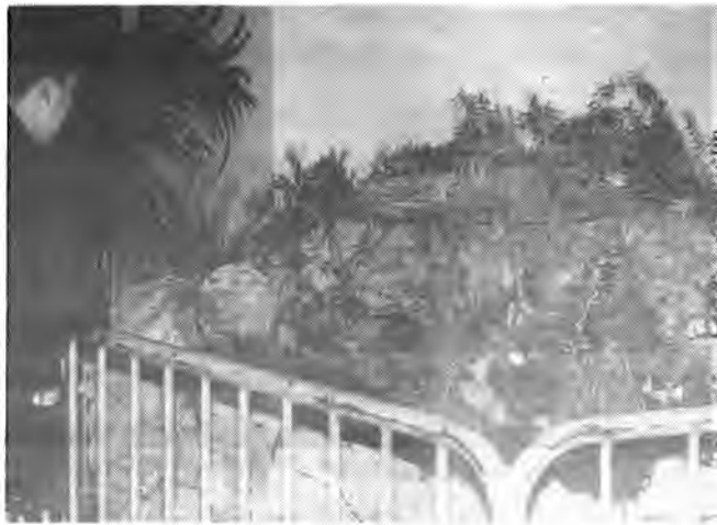
En el Ayuntamiento ya se respira el ambiente navideño.

Como viene siendo habitual en estas fiestas de la Navidad, además de haber adornado las calles céntricas de la ciudad, también se ha colocado un «betlem» en los bajos de la Casa Consistorial, así como se ha procedido a la iluminación de la fachada de la misma.