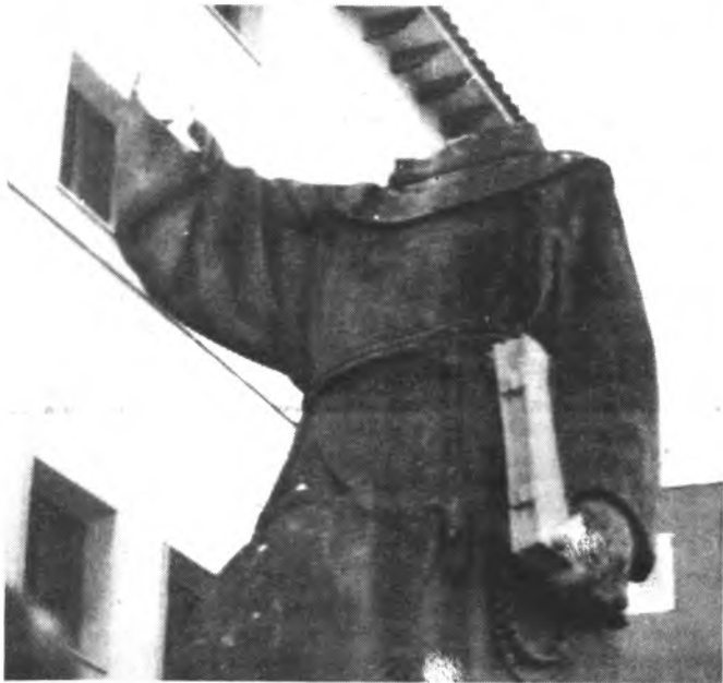
La imagen del Pare Serra, objeto de una salvajada.

No es la primera vez que la imagen del Pare Rafel Serra, es víctima de las iras de algunos «salvajes», en distintas ocasiones había sido objeto de algunos desperfectos, principalmente en la mano izquierda, pero nunca hasta ahora los destrozos que habían realizado habían sido tan importantes.