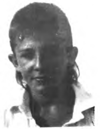
Antuan del Alevín Sallista.

Sabemos de fuentes dignas de todo crédito que