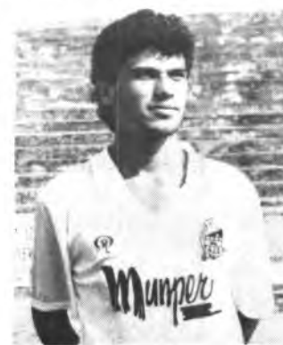
Llobera, un valor en alza.

Frente al Hospitalet, equipo que sucumbió en Inca por dos tantos a cerop, Llobera estuvo francamente bien. Ocho días más tarde, en Santa Eulalia de Ibiza, se repitió la historia, y finalmente, el pasado domingo frente al potente Alayor, Llobera ya dejó estela de su condición de jugador titular dentro del sistema táctica del cuadro de Inca.