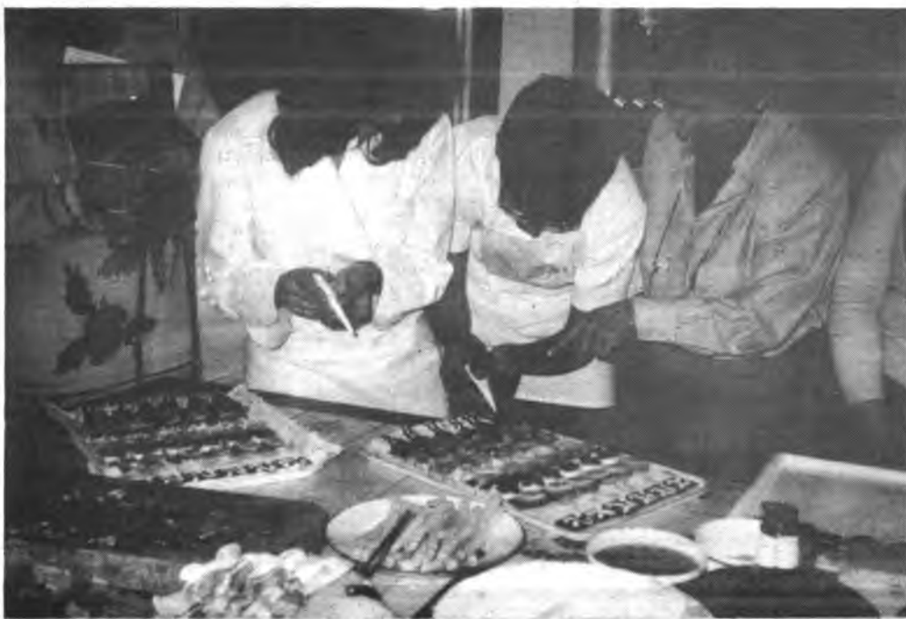
Ca'n Amer, un año más celebra su edición de Cuina Mallorquina».