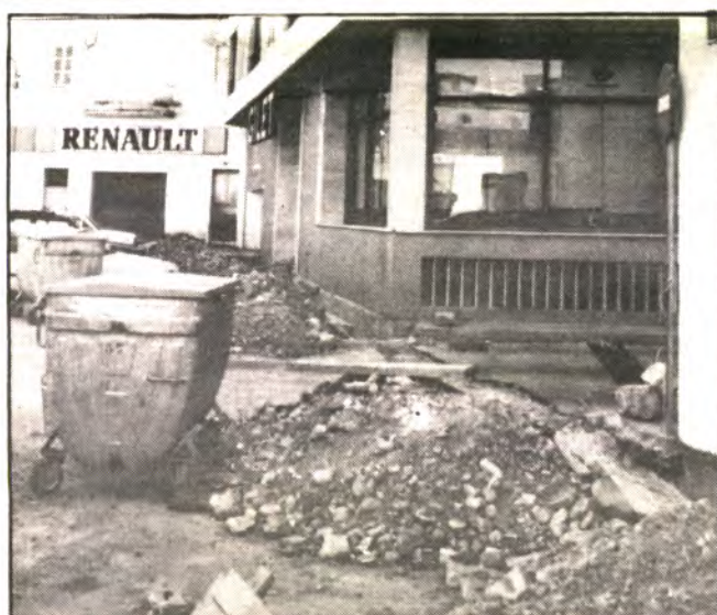
Eternas obras de la Plaza de la fuente.