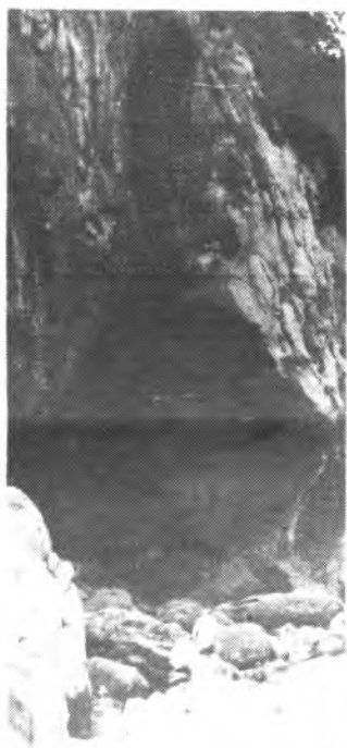
El Torrent de Paries.

El domingo a las 8 de la mañana habrá la concentración en la Plaça des bestiar, desde aquí se saldrá en autocar hasta Escorca, y desde allí se comenzará la bajada a pie. En el «Entre-fore» habrá una merienda para reponer fuerzas y luego continuar la bajada hasta Sa Calobra, para poder bañarse y luego reponer fuerzas y por la tarde