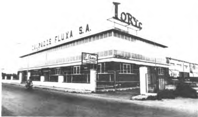
La fábrica Fluxá, una fábrica centenaria que cerrará sus puertas.