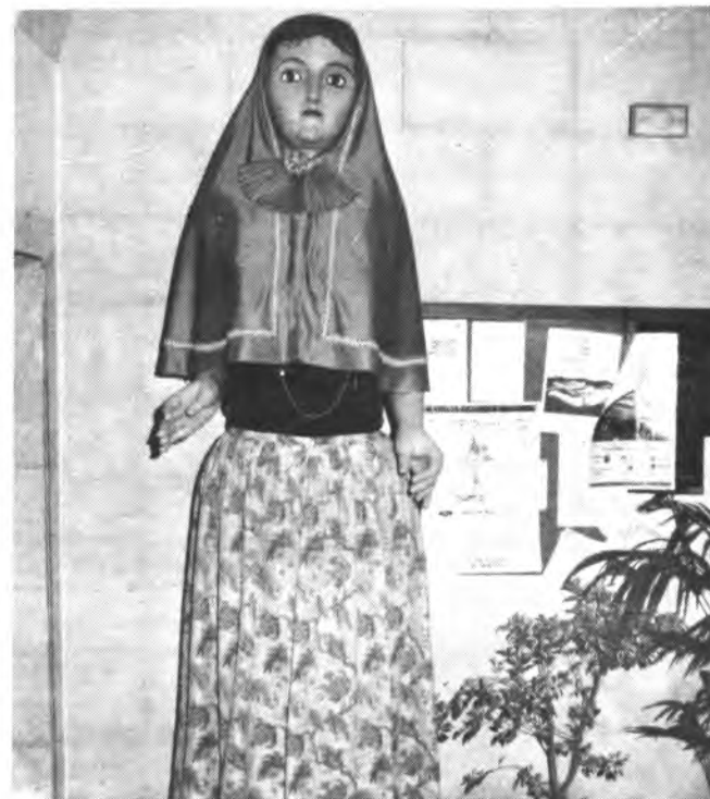
De nuevo las fiestas presentes en nuestra ciudad.

SABADO DÍA 30 (Diada patronal de San Abdón y San Senén).- A las 9'45 suelta de cohetes, Majorettes, pasacalles con la Revelta d'Inca y posteriormente misa solemne en la Parròquia de Santa María la Mayor, con la presencia de las Autoridades inquenses. A las 11'30.- Suelta de cohetes y visita de las Autoridades locales a la Residencia de Ancianos «Miquel Mir». A las 16 horas, tiro pichón.