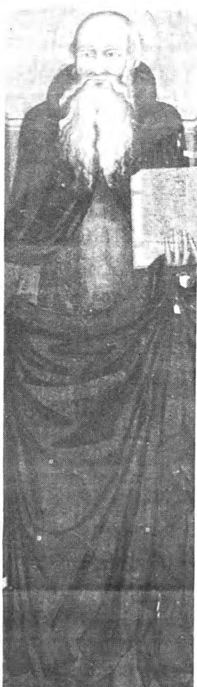
SANT ANTONI DE VIANA (Parroquia de Binissalem)