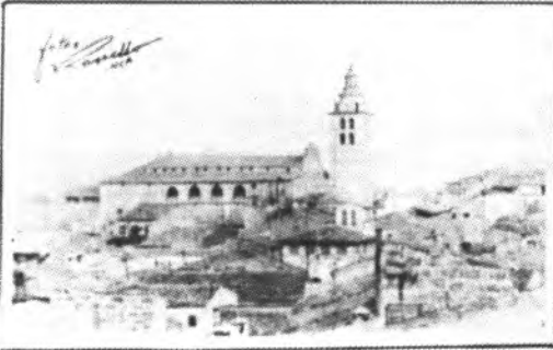
Detalle del último número.