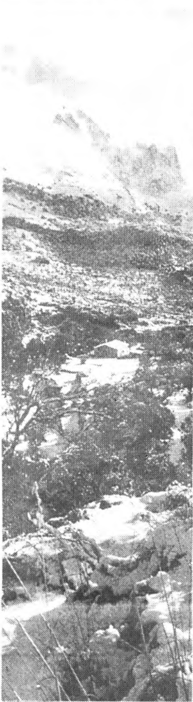
SIERRA, NEVADA, DE TRAMUNTANA