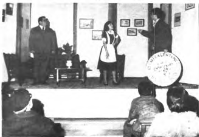
El Grupo Artístico representará «Mestre Lau es taconer».