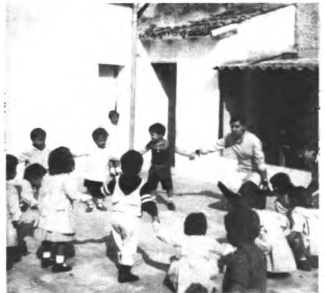
La educación de la infancia, objeto del cursillo.