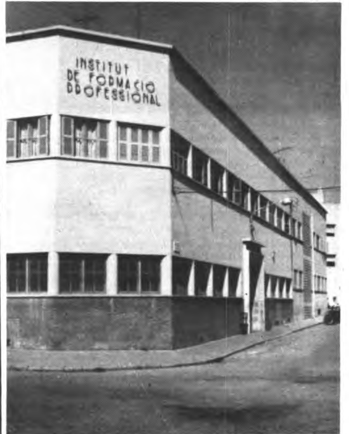
El Institut de Formació, tendrá nombre propio.

El anterior consistorio inquense intentó donar el nombre de «Marc Ferragut» el inquense que construyó el «Auditorium» palmesano al centro de Formación Profesional. Esta moción del Ayuntamiento no contó con el beneplácito de todos los grupos políticos ni también del claustro de profesores del citado centro que opinaban que era una ingerencia del Ayuntamiento la dotación de este nombre al centro.