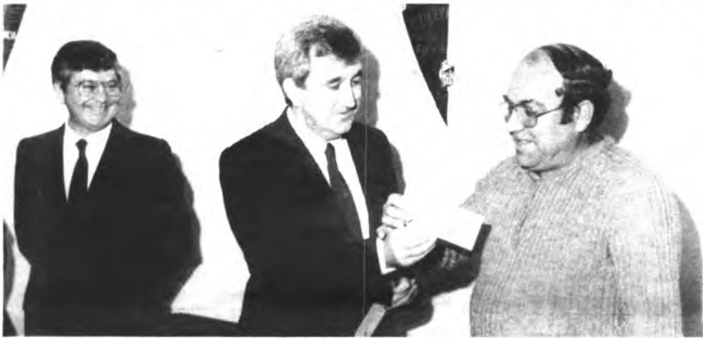
El President Gabriel Cañellas, estarà present en las fiestas.

Organizado por la Asociación de Vecinos Ponent, y patrocinados por el Ayuntamiento de Inca, Consell Insular de Mallorca, Alianza Popular Inca, y la colaboración de distintas casas industriales de la barriada tendrán lugar durante los días 1, 2 y 3 de julio las fiestas populares de cada año con el siguiente programa de actos: