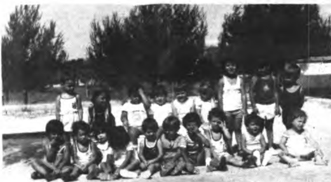
Importante cursillo de reciclaje.