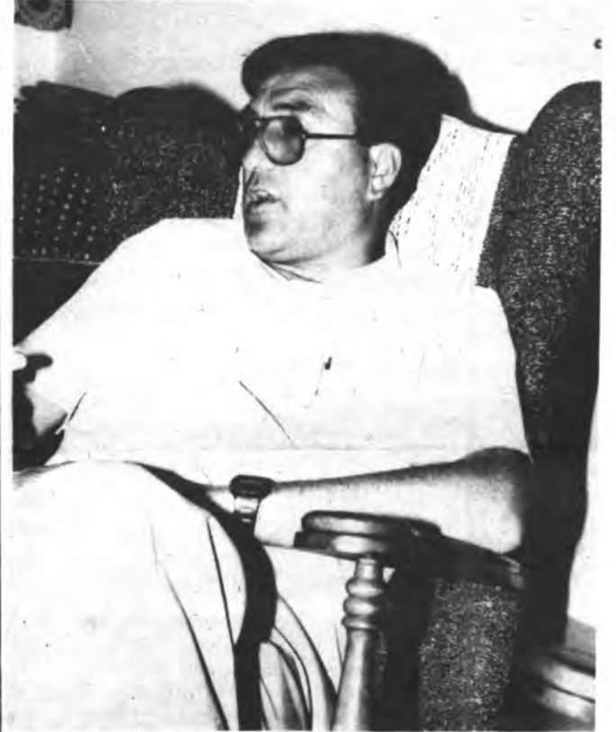
Mn. Salom, el domingo se despedirá de los inquenses.