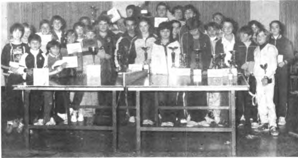
Una oportunidad para los chicos.