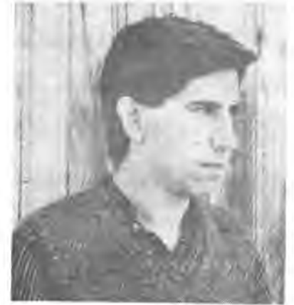
Jaume Sureda, uno de los cantautores importantes.