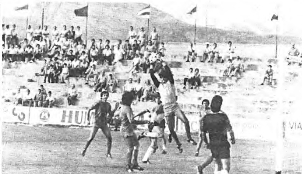
El Constanca debe ganar al Tarrasa.