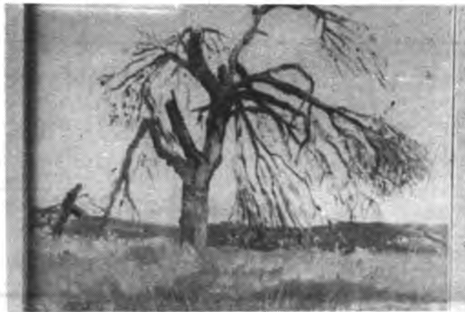
Una de las obras de Isabel Garcías.