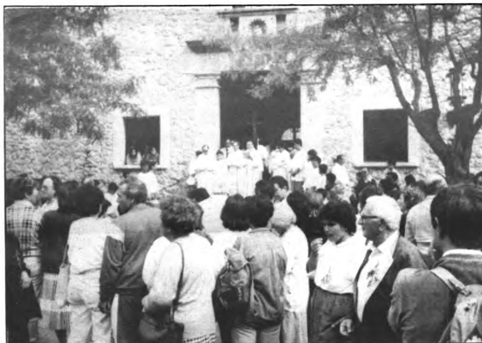
La Pascua familiar, volverá a congregar a mucha gente a Lluc.

El horario será el siguiente.— A las 10 de la mañana llegada y salutación en el interior de la Basílica a la «Moreneta». La