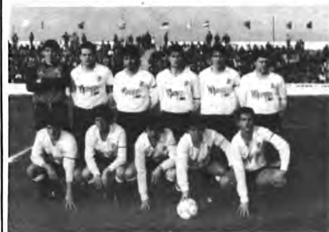
Equipo del Constancia.