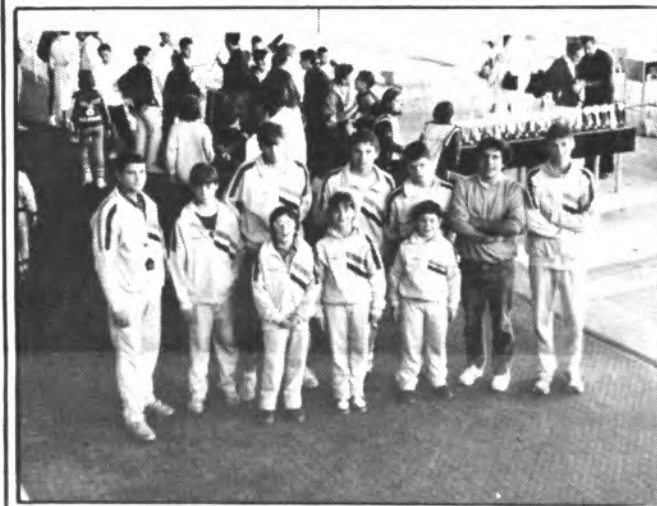
Los nadadores de Sport Inca, en un buen momento.