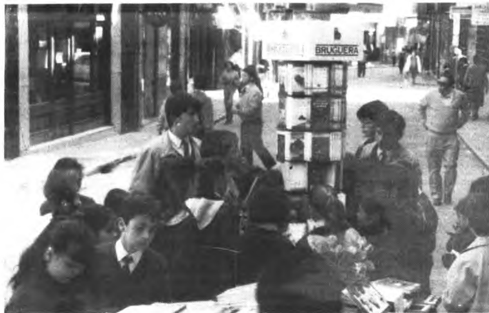
El libro, el protagonista de estos días.