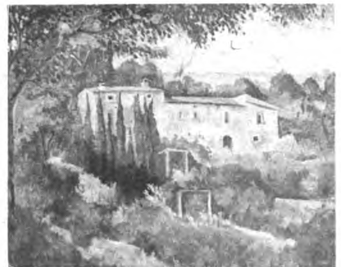
Obra de Gabriel Siquier.

«Del artista inquense dicen: si bien Gabriel Siquier nació en Inca, por ascendencia y relación con el paisaje de Po-