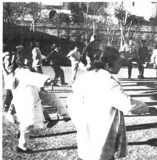
El club d'Esplai S'Estel realiza una buena labor.

Casa mortuoria: Calle Murta, n.º 27. «Ca'n Biel d'es Molí» — INCA.