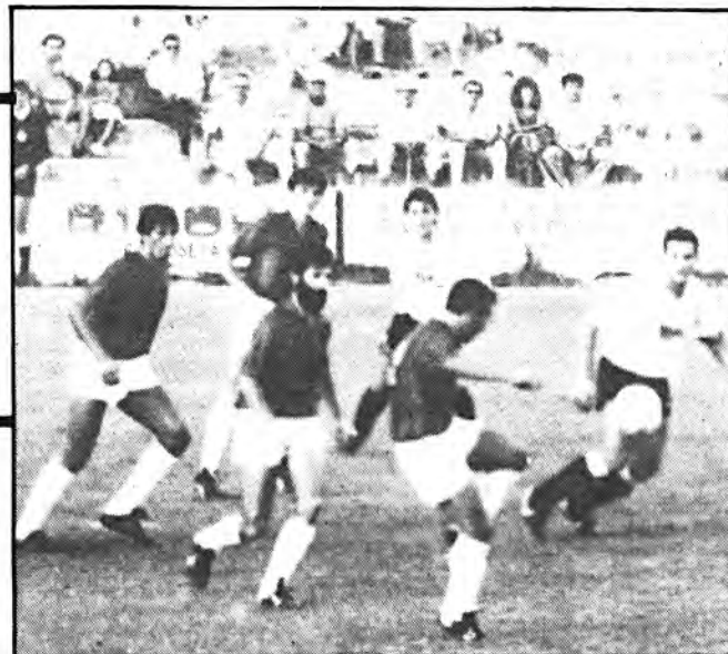
El Constancia necesita una victoria en campo contrario.

SEMINARIO DE CREATIVIDAD PLASTICA Y LITERARIA NIÑOS DE 7 A 14 AÑOS Teléfono: 50 11 70