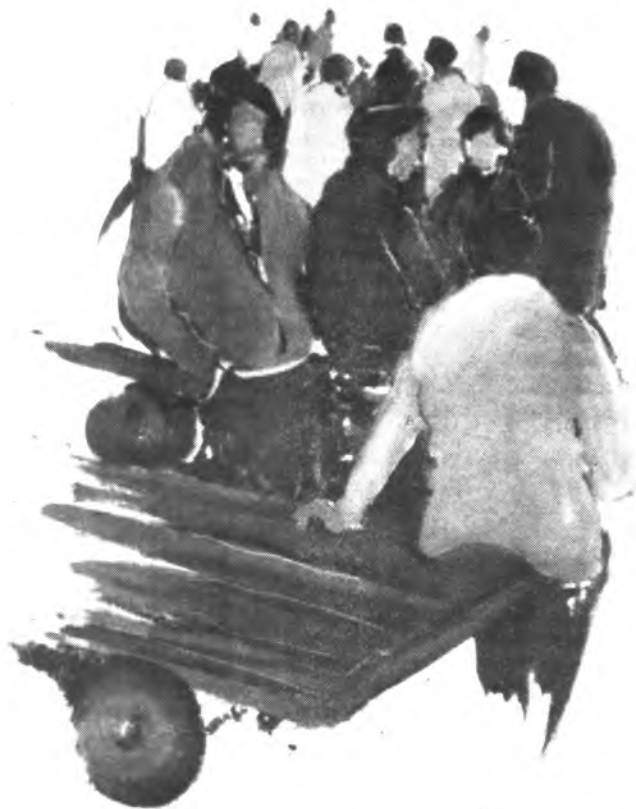
Obra de Martín Vergoñós.