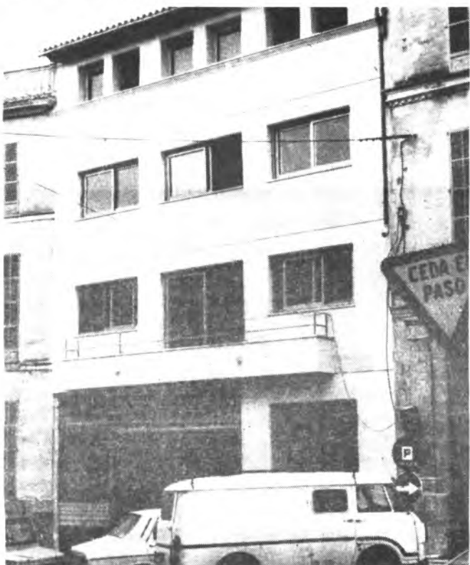
Detalle de la antigua fábrica Fluxá.