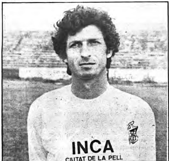
Vaquer, ¿solución a los problemas, de gol