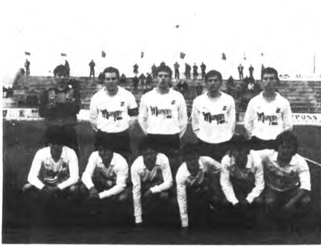
El Constancia, derrotado en Teruel.