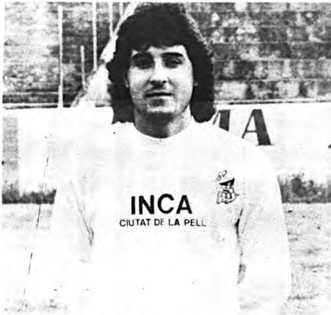
Doro, destacó en Teruel