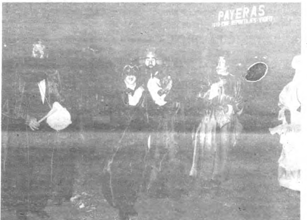
Las fiestas del carnaval 88, muy animadas.