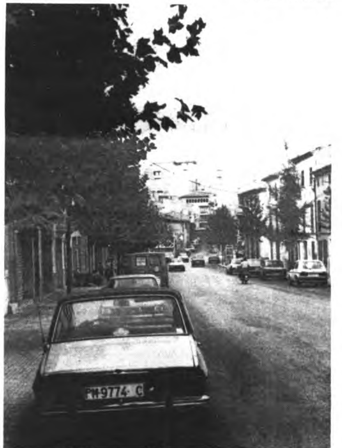
Los árboles dan un aire nuevo.