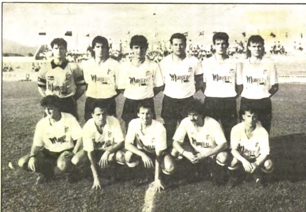
El Constancia debe anotarse el triunfo ante el Mollerusa.

El Constancia el sábado recibe al líder Mollerusa