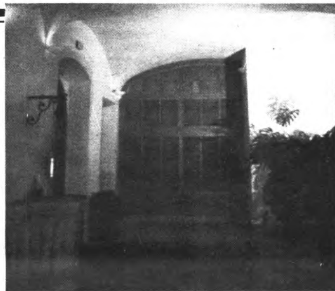
Los edificios del Ayuntamiento suben muchos millones