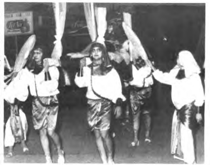
Detalle del año anterior.