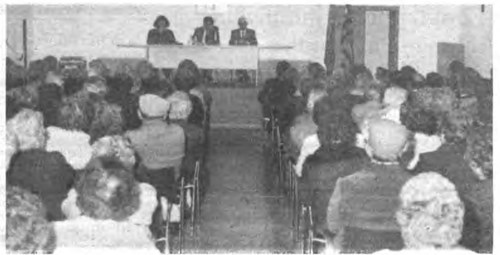
Aspecto del homenaje a Torrandell. (Foto: Payeras).