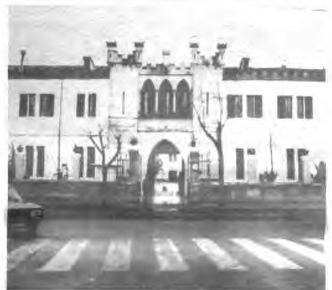
Varios detalles del Cuartel General Luque.

que se le podría sacar mucho jugo en beneficio de la ciudad.