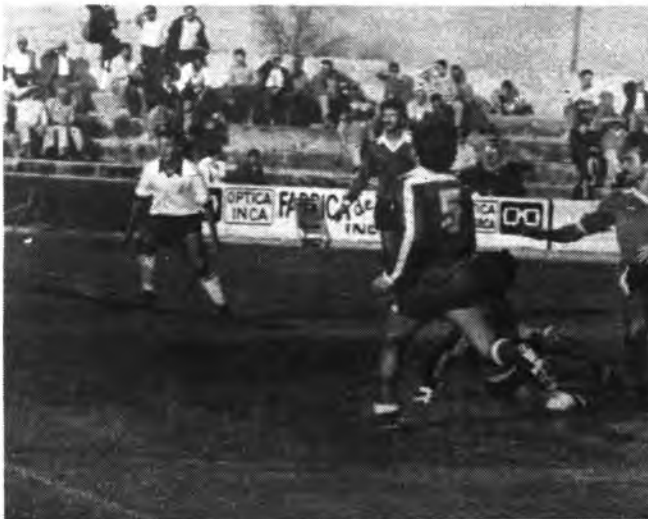
El Constancia debe anotarse el triunfo en Inca.