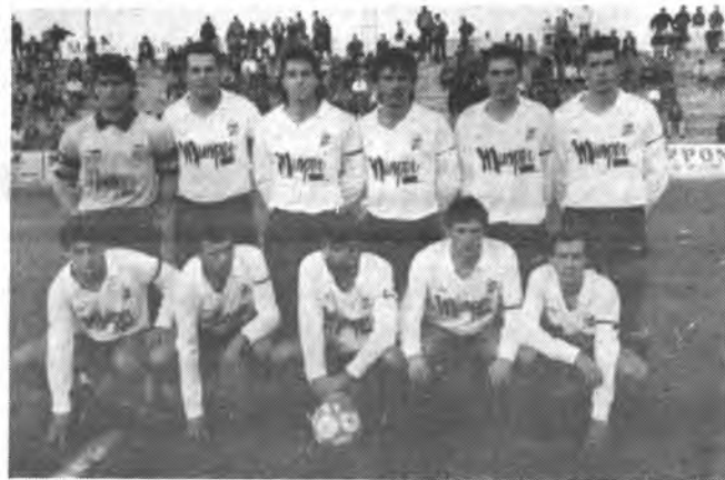
Equipo del Constanca.

Una vez finalizada la confrontación, y que representó un duro golpe para la moral del Constanca, por aquello del injusto tres a cero encajado. La moral no ha decaído en el seno de la plantilla del Constanca. Principalmente, porque su entrenador, Luis Cela, ha sabido crear un clima óptimo para el trabajo cotidiano, trabajo orientado primor-