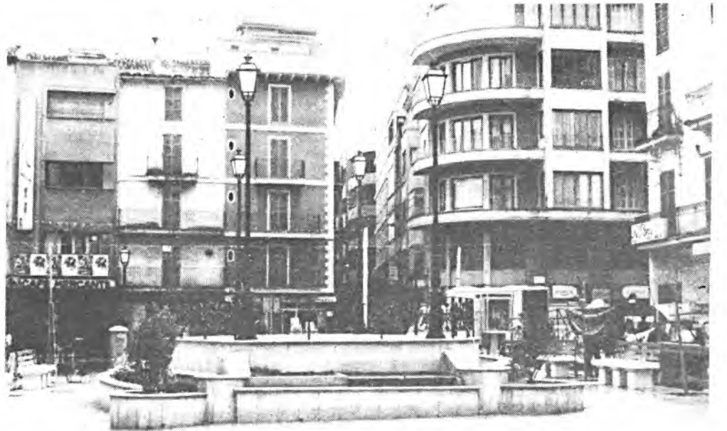
Varias instantáneas del mercado inquense (Fotos: J. Riera).

mil pesetas anualmente por metro no es una cantidad absurda. Prueba de ello es que ya han abonado el importe de sus puestos unos 200 placers, y ahora estamos en una temporada baja, que vienen semanalmente sobre unos 400, estamos el 50 por ciento y por otra parte hay gente que ha pedido más metros en el Ayuntamiento que los tiene actualmente.