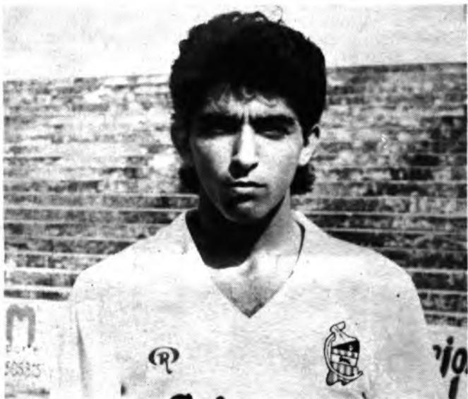
Mas, un jugador en alza.