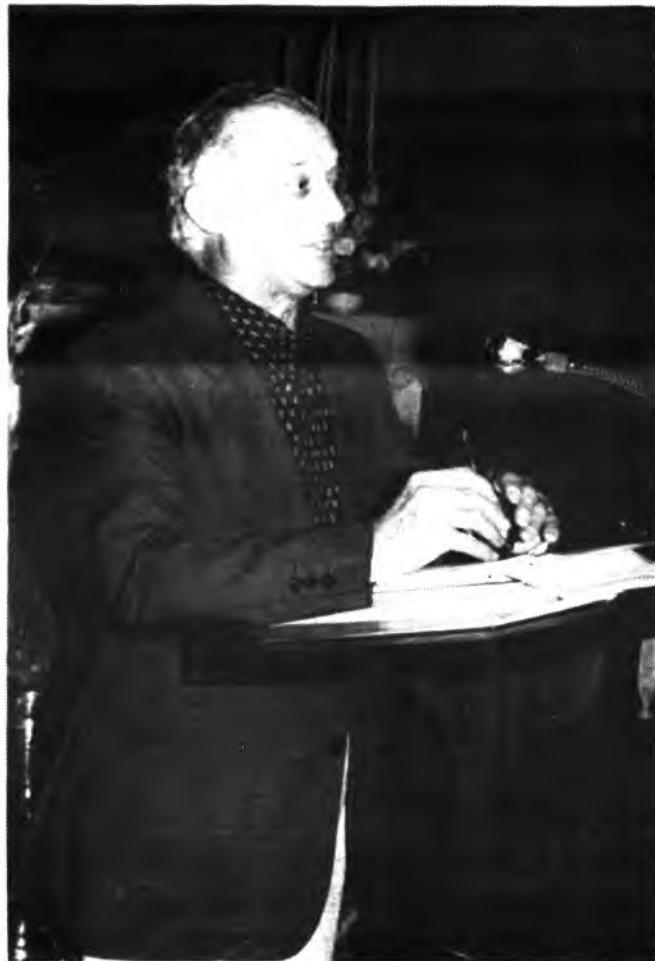
Detalle de las fiestas de Santo Domingo.