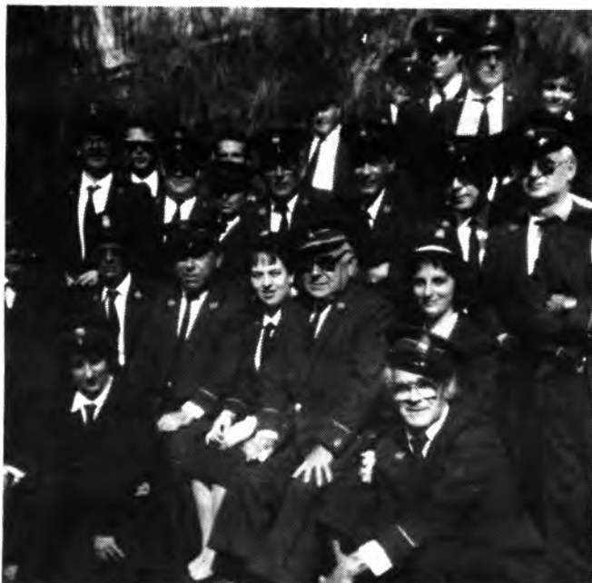
Madrina de «La Unión Musical Inquense».

Para que sepa el pueblo de Inca que existe una Banda de Música, aquí van estas dos fotografías para refrescar la memoria, de lo que vale tener una Agrupación de tal valor, y que apenas se les hace caso.