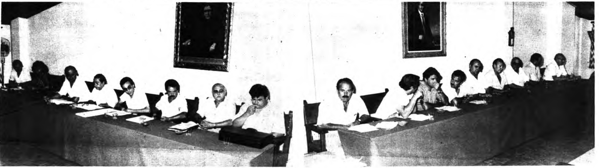
Varios detalles de la sesión plenaria.

El Ayuntamiento inquebrantable celebró la primera sesión plenaria con carácter extraordinario, la misma comenzó a las doce del mediodía y se alargó por espacio de poco más de una hora. A la misma asistieron la totalidad de reidores que componen el Ayuntamiento.