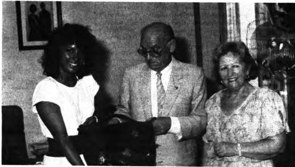
Detalle del acto.