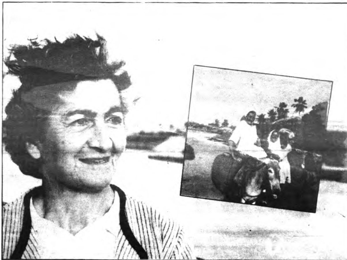
Cuarenta y tres años de misionera en la selva Guapirecha