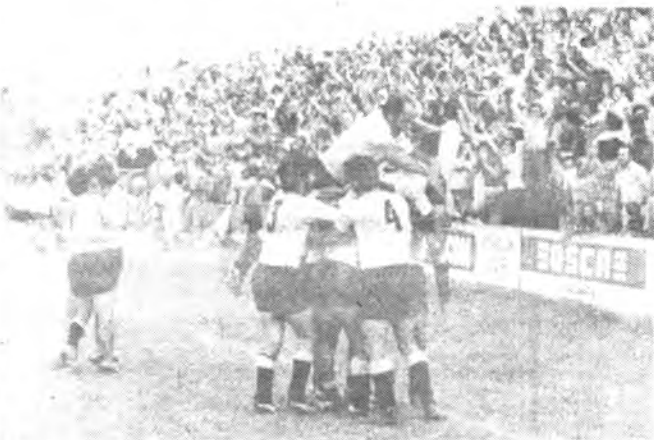
¿Volverán los tiempos victoriosos para el cuadro de Inca?.